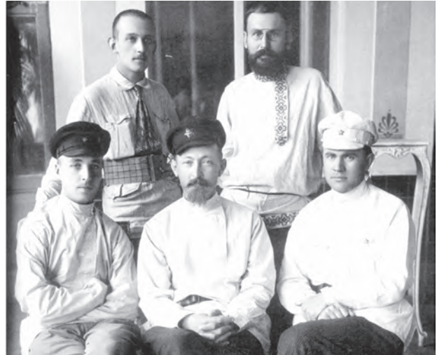
Харків. Літо 1920. Сидять зліва направо: Василь Манцев – начальник ЦУПНАДКОМу, Фелікс Дзержинський, Всеволод Балицький – заступник начальника ЦУПНАДКОМу

Русопятства я не замечал, да и жалоб не слышал. В области моей специальности – здесь обильный урожай. Вся, можно сказать, интеллигенция средняя украинская – это петлюровцы... Громадной помехой в борьбе – отсутствие чекистов-украинцев» 17 (прикметно, що виділені нами слова не увійшли до радянських 18 та сучасних російських видань, присвячених діяльності Ф.Е. Дзержинського 19 ).