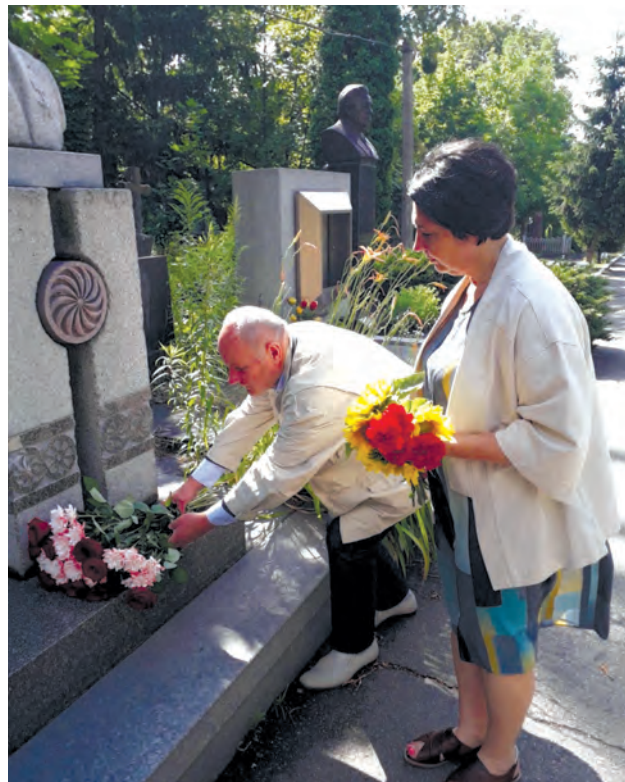
Голова НСКУ Олександр Реєнт та заступниця голови НСКУ Руслана Маньковська покладають квіти до могили Петра Тронька. 12 липня 2022 р.

Франківської обласної організації НСКУ. Президія Співки за поданням Івано-Франківської обласної організації нагородила А. Королька Премією імені академіка Петра Тимофійовича Тронька. Краєзнавець є автором понад 50 наукових і навчально-методичних публікацій; учасник понад 20 міжнародних, всеукраїнських та регіональних конференцій.