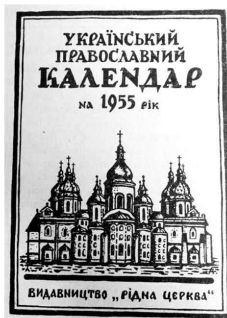
Титульна сторінка українського православного календаря на 1955 рік кишенькового формату.