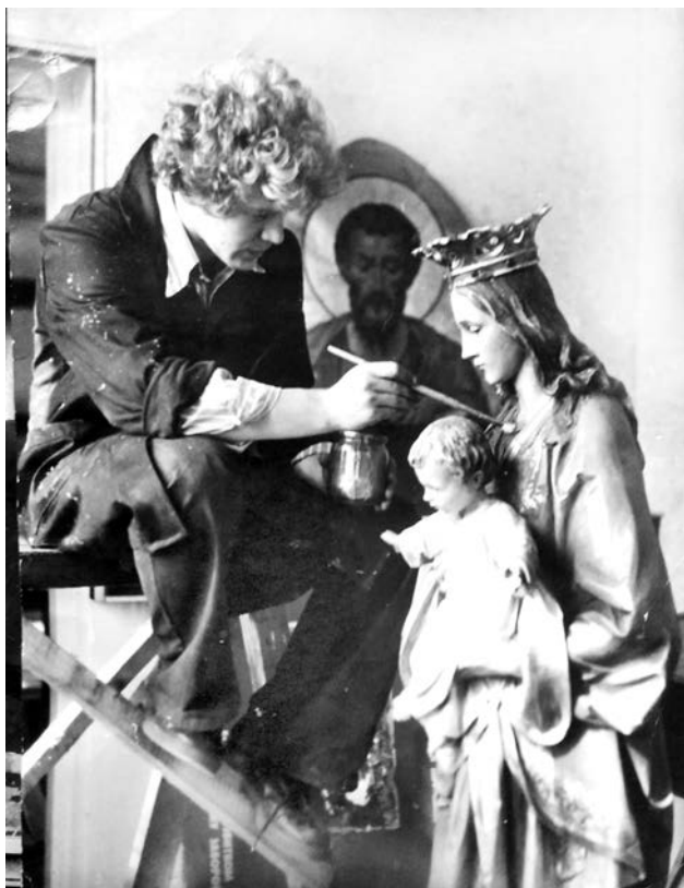
Підготовка виставки «Сакральне мистецтво». м. Почаїв 1977 р.