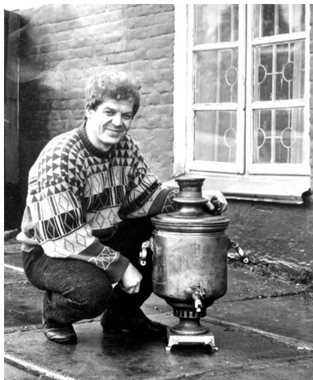
"Ніколи друзі Вас не забуваю, запрошую на дружню чашку чаю". м. Почаїв, 1984 р.