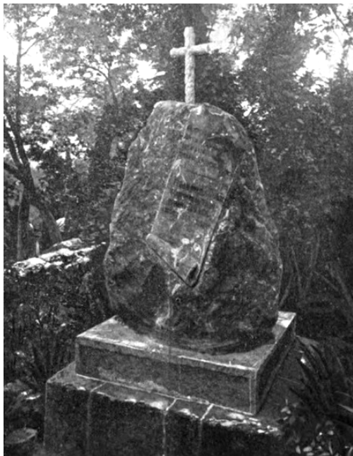
Пам'ятник на могилі Степана Руданського на старому цвинтарі в Ялті. Осінь 1895 року.

а внизу “1892”, коли поставлено пам'ятник” 12 .