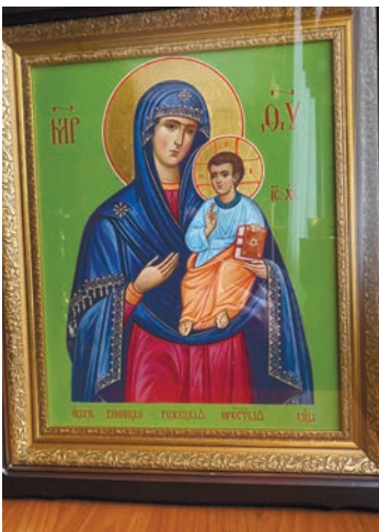
Копія Рожанської ікони Божої Матері (Вінницький жіночий монастир на честь Благовіщення Пресвятої Богородиці (фото 01.12.2022 р.)

Відповідно до рішення Священного Синоду Православної Церкви України від 22 листопада 2021 року № 8 «Про прославлення шанованих ікон Божої Матері «Вінницька» («Вінницько-Рожецька»), «Далешівська», «Ласкава Станіслав-