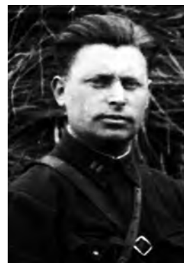
Григорій Костянтинович Блінкін

Блінкін Григорій Костянтинович (1907 – ?). Народився у м. Степанці Київської губернії. Член ВКП(б) з 1926 року. В ОДПУ з 1930 року. У 1937–1938 рр. – оперуповноважений Ладижинського райвідділу НКВС.