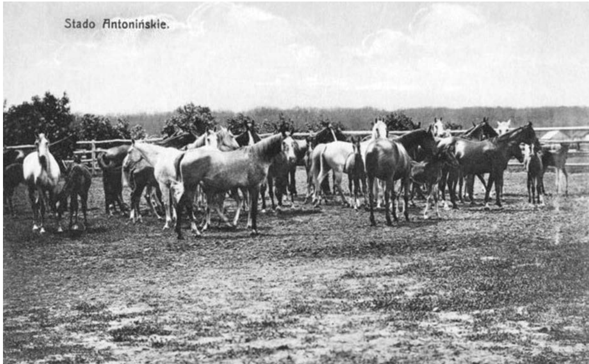
Іл. 11. Антоніни. Видання В. Кшишковського, 1910–1914 рр.

листівки популяризували економічні досягнення, архітектурні новації та аристократичний спосіб життя власників маєтку. Їх трансформація зумовлювалася зростаючими потребами меценатства, масштабами участі в суспільному і культурному житті, прагненням наслідувати європейську аристократію. Важливу роль відіграла політика престижу, що мала підкреслювати можливості та розкіш меценатів. Власники Антонін намагалися сформувати своє оточення так, щоб підкреслити своє виняткове становище