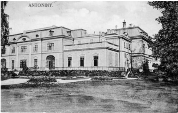
Іл. 5. Південний фасад палацу після перебудови за проектом Ф. Фельнера.

Львів: Зейфарт і Дидинський, 1905–1906 рр.