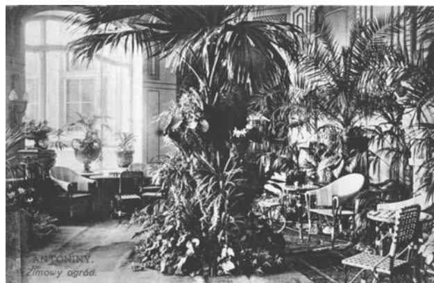
Іл. 4. Антоніні. Зимовий сад. Видання В. Кшишковського, 1910–1914 рр.

штової листівка «Антоніні. Зимовий сад» (див. ілюстр. 4), що зображує інтер'єр цієї частини палацового комплексу. Простір зимового саду оформлено відповідно до тогочасних канонів: екзотичні пальми, папороті й інші квіткові рослини в керамічних горщиках були розміщені серед витончених меблів з ротангу, що підкреслювало статус та естетичні вподобання власників. Архітектурне вирішення – скляна стеля та панорамні вікна – створювало оптимальні умови для існування теплолюбних рослин і водночас надавало інтер'єру вишуканої легкості.