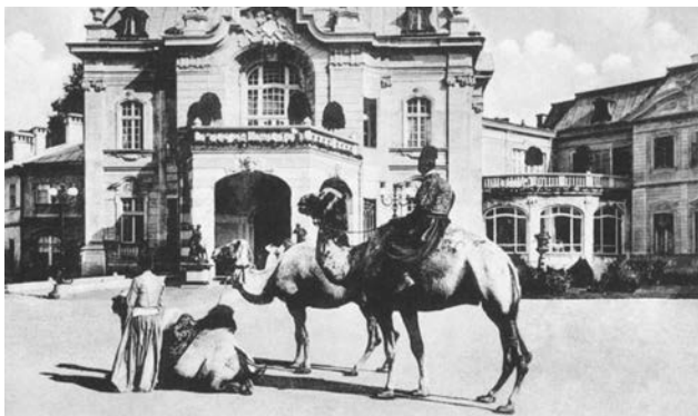
Іл. 3. Антоніні. Вид головного фасаду палацу. Видання В. Кшишковського, 1910–1914 рр.

Через кілька років на поштової листівці В. Кшишковського зафіксовано, що біля головного фасаду маєтку перед арковими колонами центральної частини будівлі встановлено бронзові скульптури мисливців з собаками, які виконані в паризькій майстерні 4 , два чавунні ліхтарі, декоративні рослини, які прикрашають терасу другого поверху та клумби біля вхідного павільйону (див. ілюстр. 3).