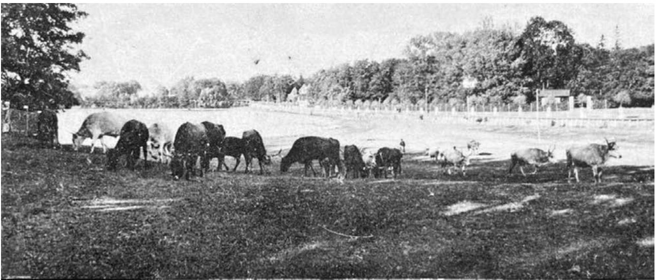
Іл. 6. Антоніни. Дамби. Львів: «Зейфарт і Дидинський», 1900–1904 рр.