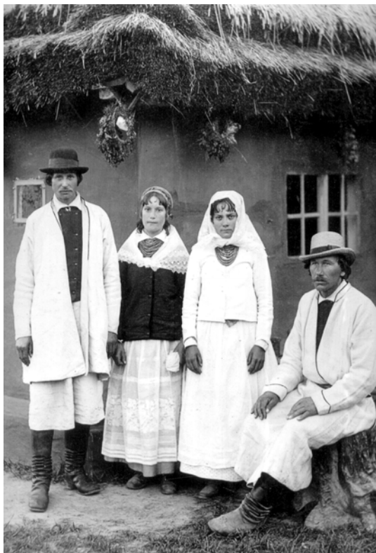
Народний одяг, район Мостиська. Етнографічна виставка в Тернополі 6 липня 1887 р. Fotog. Alfred Silkiewicz w Tarnopolu, [1887]

Фонд фотографій Відділення «Палац мистецтв імені Тетяни та Омеляна Антоновичів» Львівської національної наукової бібліотеки України імені В. Стефаника становить важливу документальну, мистецьку та інформаційну цінність. Наукове опрацювання фонду дасть можливість широко використовувати його для історичних, мистецтвознавчих, літературознавчих досліджень, укладання каталогів і покажчиків, організації виставок.