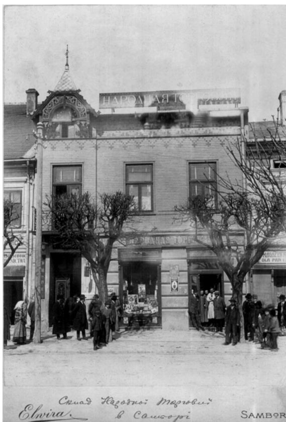
Склад Народної Торгівлі в Самборі. Zakład artystyczno fotograficzny Elwira w Samborze, [поч. XX ст.]