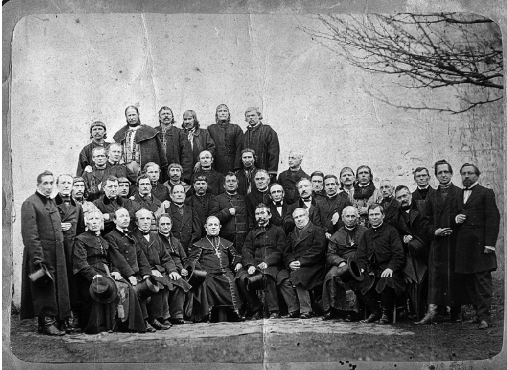
Руські послы до Сейму 1861 р.