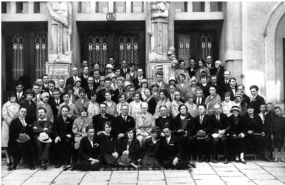
Хор «Львівський Боян» в Перемишлі 26 травня 1929 р. з нагоди 100-літньої річниці заснування першого українського хору в Перемишлі