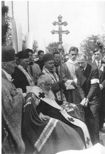
Фото 4. Посвята каменя під «Народну лічницю» у Львові на вул. П. Скарги. Львів, 1938 р.