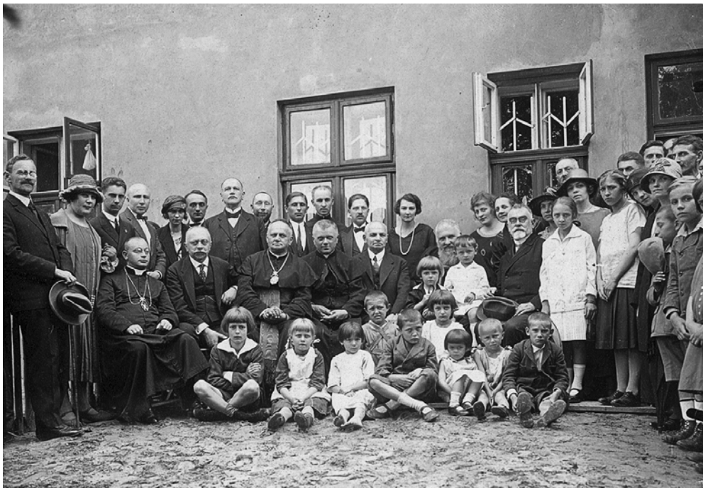
Фото 1. Митрополит Андрей, Кость Левицький та інші на посвяченні дому «Порадня для матерів» на вул. Ходоровського. На звороті — власноручний підпис Митрополита Андрея. Львів, червень 1926 р.