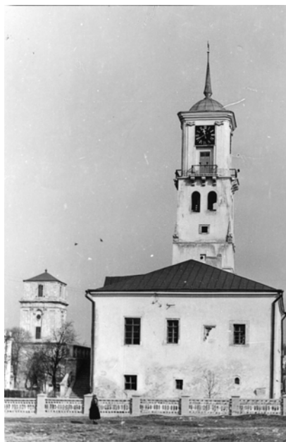
Міська ратуша XIV ст.