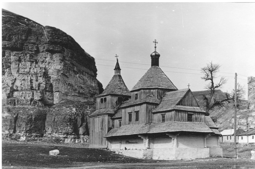
Церква Воздвиження Чесного Хреста на Карвасарах