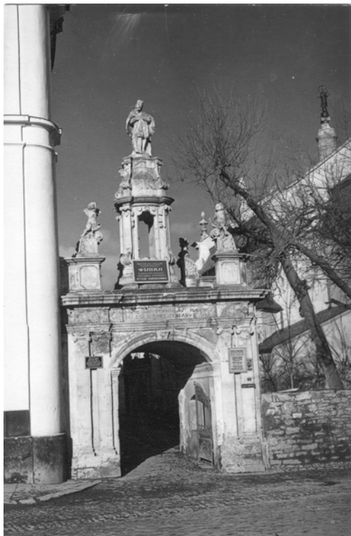
Тріумфальна арка Станіслава Августа