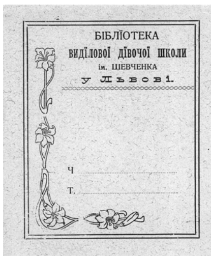
Бібліотека виділової дівочої школи ім. Шевченка у Львові : Ч. Т. (б. р.)

Шевченко посідає місце особі й виняткове — настільки виняткове, що духовна історія України від часу його появи й дотепер розгортається, необхідно співвідносячись із ним (і самовизначаючись щодо нього) як із своєрідним абсолютом — символічно персоніфікованою, втіленою єдністю сутності й існування в межах національного світу [...]. Відтак усяке пізнання Шевченка виявляється, ео ірсо, національним самопізнанням» [4, с. 34]. Художники акцентували увагу на генії у точному розумінні латинського слова: дух всесвіту, опікунський дух людства та індивідів. Феномен Т. Шевченка постав у 1840-х рр., коли есхатологічні настрої в українському суспільстві набули практичного звучання, оскільки визначалися пошуками майбутнього самої Росії. Саме тоді він перейняв на себе роль борця за майбутнє українського народу, почав говорити про українську ідею: «Обніміться ж, брати мої! Молю вас, благаю» [23, с. 380].