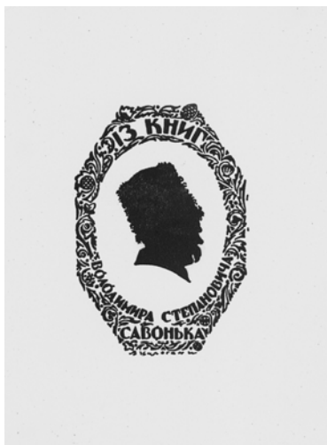
Цілоسانی Л. Із книг Володимира Степановича Савонька (1936 р.)