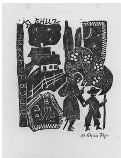
Буга І. Із книг В. Вітрука: І виріс я на чужині... (1971 р.)