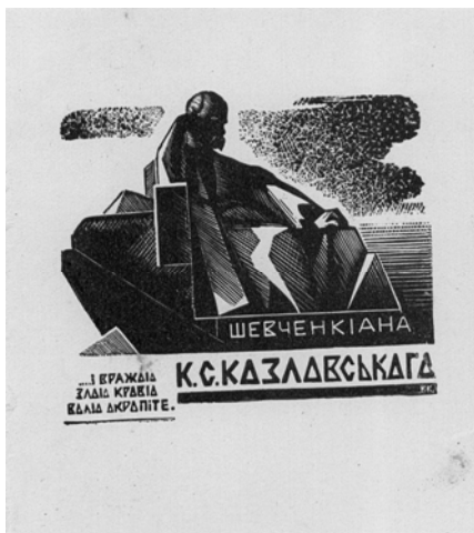
Козловський К. (ст.). Шевченкіана К. С. Козловського : І вражою злою кров'ю волю окропіте (б. р.)