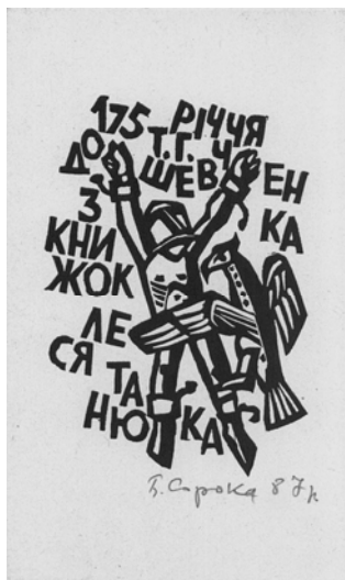
Сорока Б. З книжок Леся Танюка : До 175-річчя Т. Г. Шевченка (1987 р.)