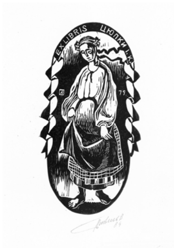
Півень В. Ex libris Цюпки І. К. (1984 р.)