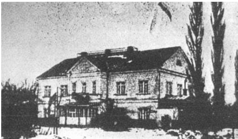
Маєток родини Наргелевичів у Войнові

слов'янського зокрема видавничого репертуару кінця XVIII — 80-х рр. XIX ст., на створення і поповнення якої досі маловідомий у Галичині польсько-литовський меценат татарського походження не шкодував ні часу, ні грошей, оскільки для нього ця книгозбірня була водночас і пристрастю, і життєво необхідною справою.