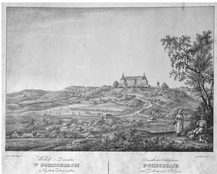
Замок в Підгірцях. А. Лянте (папір, літографія)