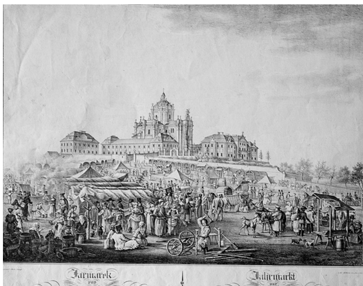
Ярмарок під собором св. Юра. А. Лянге (папір, літографія)