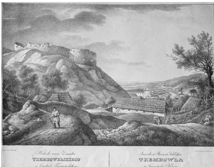
Вид замку в Теревовлі. А. Лянге (папір, літографія)