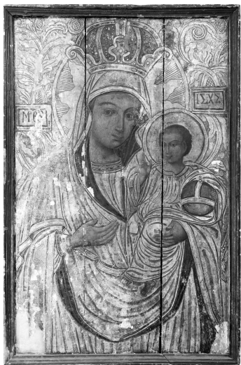
Іл. 7. «Богородиця Одигітрія», XVIII ст., Унів