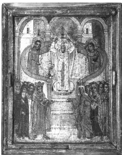
Іл. 6. «Воздвиження Чесного Хреста», перша пол. XVII ст., с. Добра