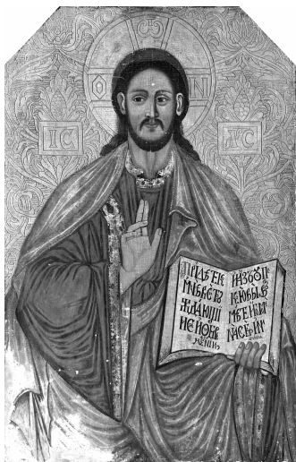
Іл. 9. «Спас», початок XVIII ст. Волинь (?)