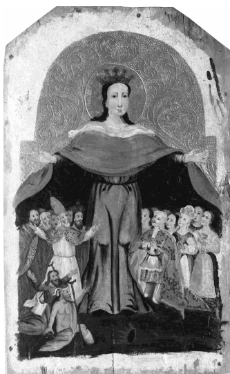
Іл. 5. «Покров Богородиці», XVIII ст., с. Новиця