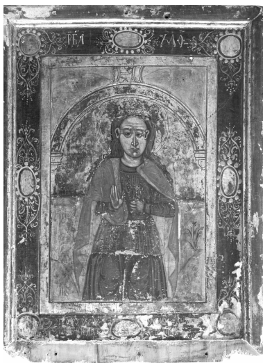
Іл. 3. Ілля Колчинський (?). «Св. Параскева», 1639 р., с. Новиця