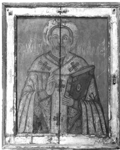
Іл. 4. «Св. Миколай», початок XVII ст., с. Новиця