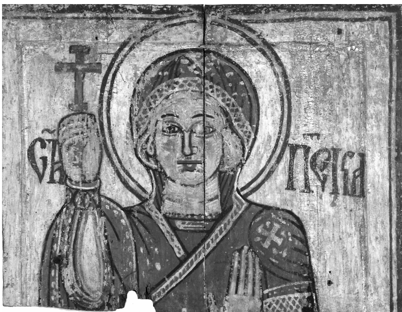
Ил. 2. «Св. Параскева», (фрагмент), кінець XVI ст., с. Новиця