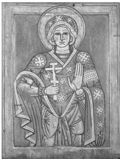
Ил. 1. «Св. Параскева», кінець XVI ст., с. Новиця