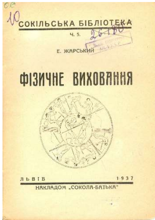
Іл. 3. Е. Жарський «Фізичне виховання». Титульний аркуш (1937)