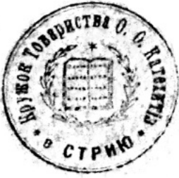
Лл. 1. Печатка осередку Товариства отців катехитів у Стрию

Майже усі відтиски в альбомі темного кольору (чорний, фіолетовий, темно-синій), три печатки червоні (парафії сіл Облазниця Жидачівського деканату, Камінь і Рожнятів Рожнятівського деканату). Більшість печаток має круглу форму, приблизно чверть — овальну.