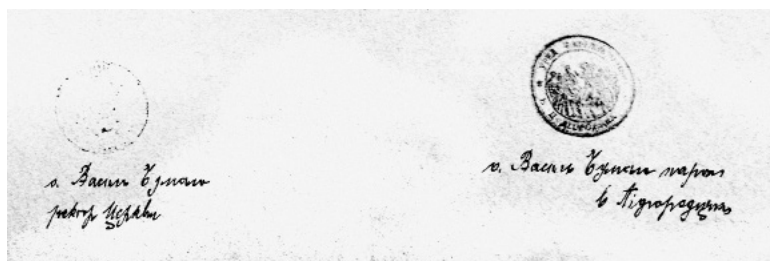
Іл. 5. Печатки, поставлені від каплиці і від парафії села Підгородці

Водночас деякі печатки парафій Перегинського деканату явно підмінені: використано одну матрицю для кількох відбитків. Так, в альбомі мали б бути парафіяльні печатки сіл Лецівка (з окремим храмом у селі Дубшара), Красна, Липовиця, Присліп (з окремим храмом у селі Майдан), Суходіл, Долішній Ясінь (з окремим храмом у селі Горішній Ясінь), проте біля підписів священників цих парафій поставлено печатку парафії села Вільхівка (Іл. 4), але без назви поселення. Відповідну частину легенди, ймовірно, було закрито на матриці клаптиком паперу (в деяких випадках підміна була невдала) і поставлено відбитки з написом: «ГР. КАТ: УРЯД ПАРОХІЯЛЬНИЙ в». Це певною мірою свідчить, що ставлення власників печаток до їхнього використання могло бути дуже поверховим, якщо йшлося про неофіційні документи.