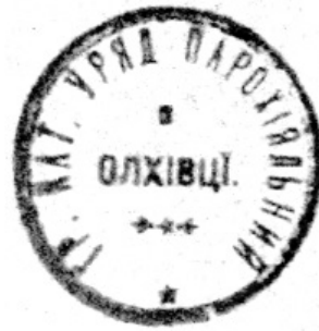
Лл. 4. Парафіяльна печатка села Вільхівка