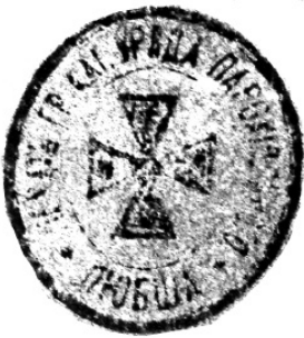
Лл. 3. Парафіяльна печатка села Любша