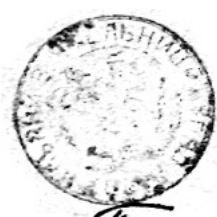
Лл. 7. Парафіяльна печатка села Ямельниця