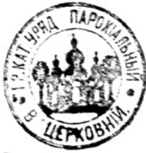
Лл. 8. Парафіяльна печатка села Церківна