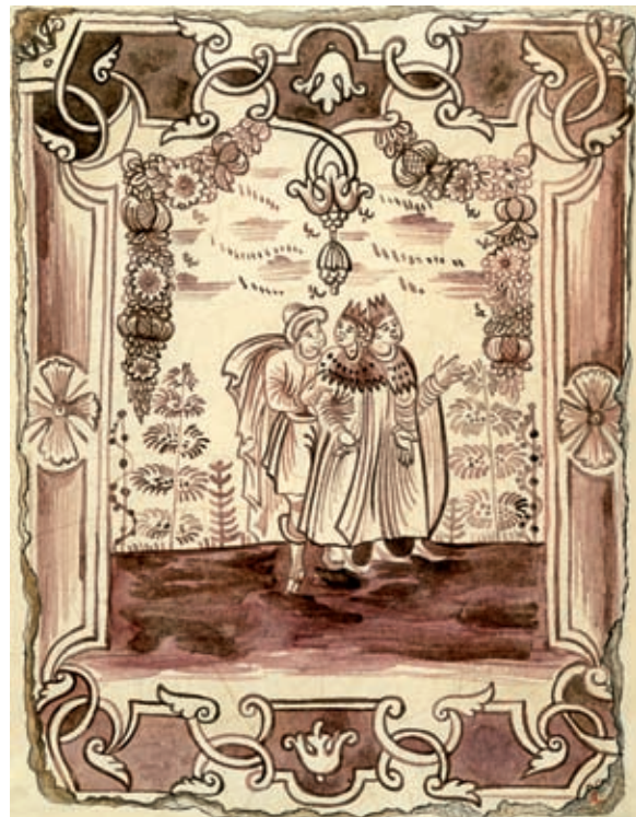
2. Орнамент кахлі «Брунатної» печі. У кімната. Покорщина. Мал. А. А. Сакс