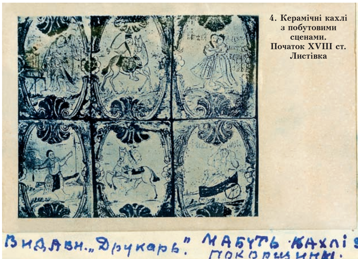
4. Керамічні кахлі з побутовими сценами. Початок XVIII ст. Листівка

У другій II, наріжній кімнаті лише одна, але ж углова піч 17 . Складено її з різно-сюжетних, але композиційно-однакових кахоль: на всіх кахлях фігури людей згруповані посередині під всюди однаковим великим деревом з п'ятью грибоподібними купами листя; по його боках (дерева) – два пагорки, на яких, хоч на обох, хоч на одному, – яки-сь будівлі.