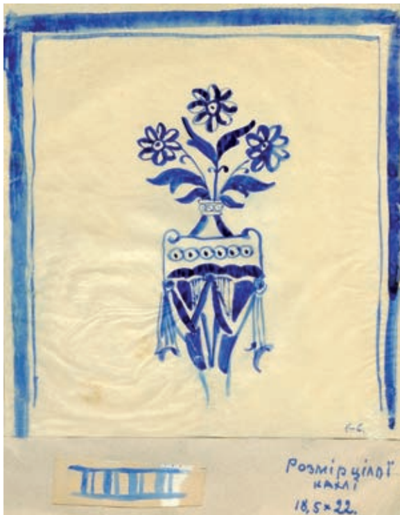
1. Орнамент кахлі