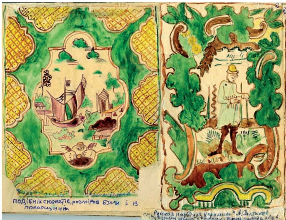
3. Подібні сюжети були на кахлях Покорщини