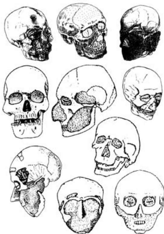
Іл. 1. Модельовані черепа катакомбних поховань Північного Причорномор'я

на Південному Бузі (розкопки О. Шапошникової), на р. Конці [31]. Ці відкриття дозволяють окреслити ареал поширення обряду в межах Дніпропетровської, Запорізької, Херсонської, Миколаївської, а також на півдні Донецької областей і в степовому Криму. Скрізь моделювання траплялося в катакомбах з округлими шахтами, овальними чи округлими камерами; кістяки витягнуті, були й розчленовані померлі. Інвентар, яким супроводжували небіжчиків, вважаємо належним до інгульської культури [35, с. 89–94].