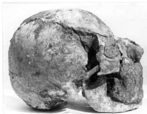
Іл. 2. Моделювання обличчя по черепу

За нашими спостереженнями, у катакомбних пам'ятках простежується різниця за якістю муміфікації. Якщо часткове моделювання (тип 2) властиве знатним померлим, то небіжчики із залишками маси в області живота належать до рядового населення [34].