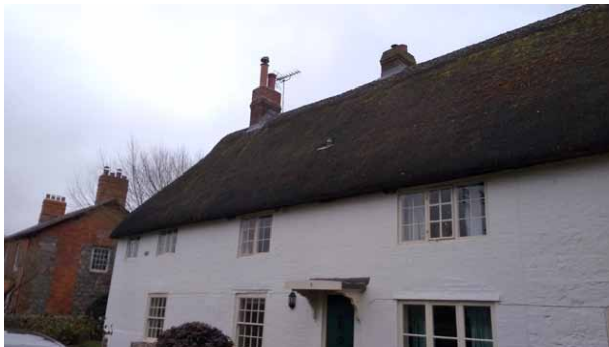
Ил. 4. Житло та садиба XIX ст. с-ще Евбері, Англія. 2018 р.