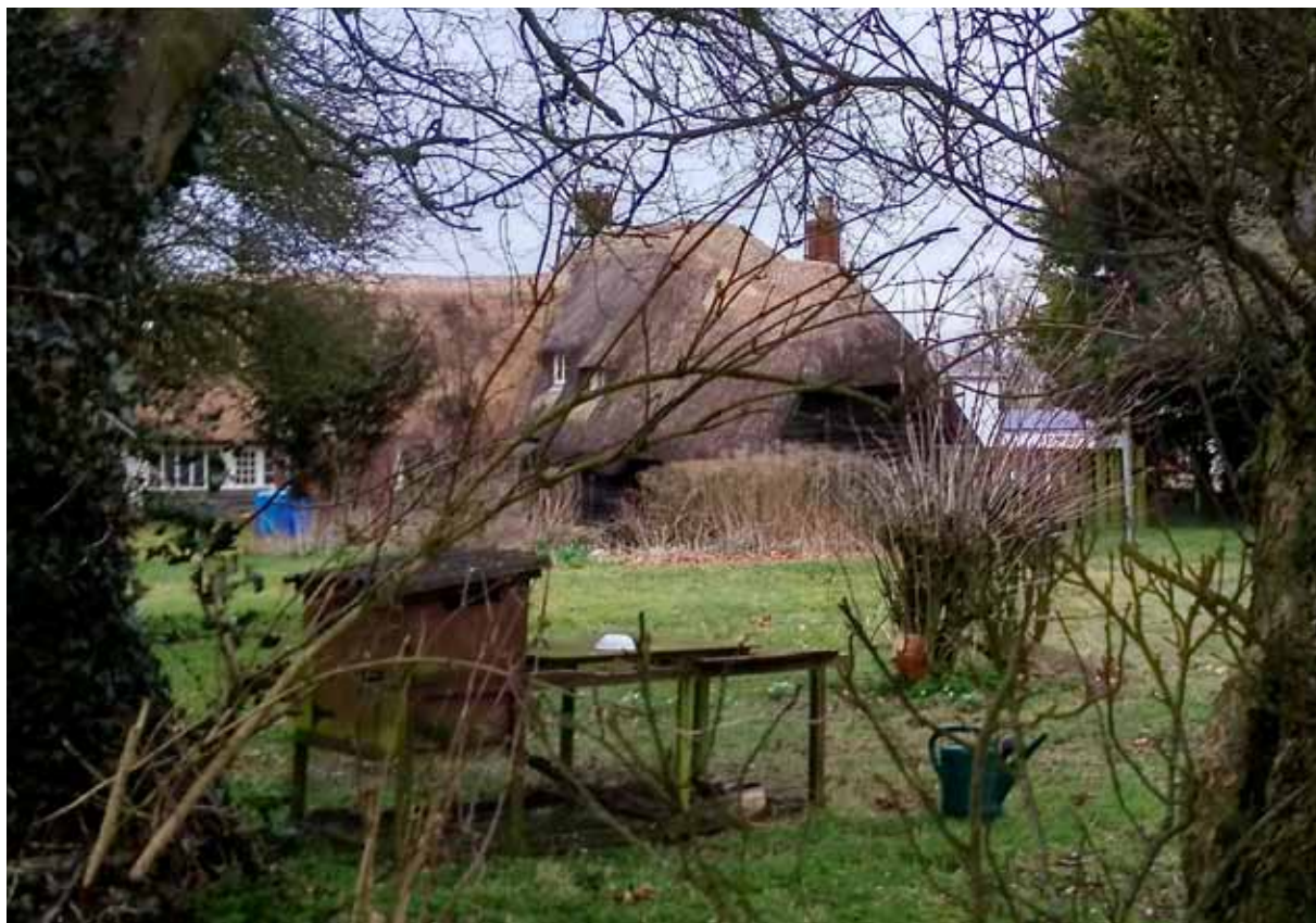
Ил. 3. Житловий будинок XIX ст. с-ще Евбері, Англія. 2018 р.