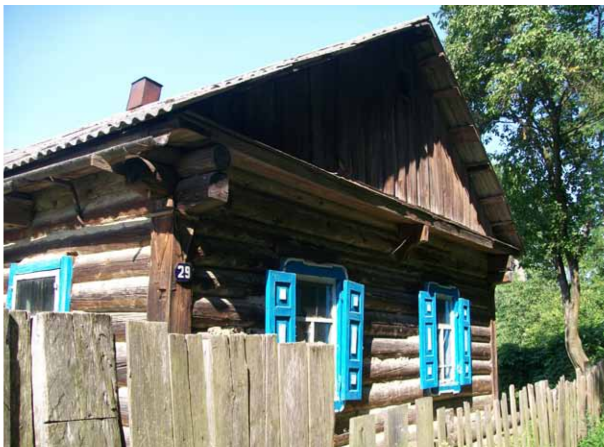
Ил. 2. Житло середини – другої половини ХХ ст. сmt Любеч Ріпкинського р-ну Чернігівської обл. 2016 р.