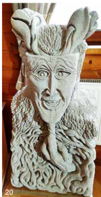
15–20. Скульптурна творчість Д. Шелковенка, мешканця с. Бобриця Бучанського р-ну Київської обл. Приватна збірка. Світлина О. Босого (2023 р.)