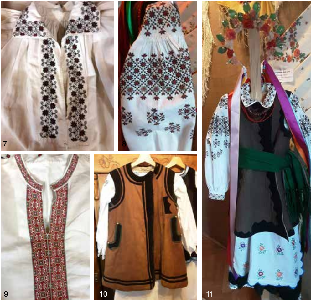
7–11. Традиційне народне вбрання. Початок – середина ХХ ст. З колекції Музею історії с. Бобриця. Світлина Л. Босої (2023 р.)