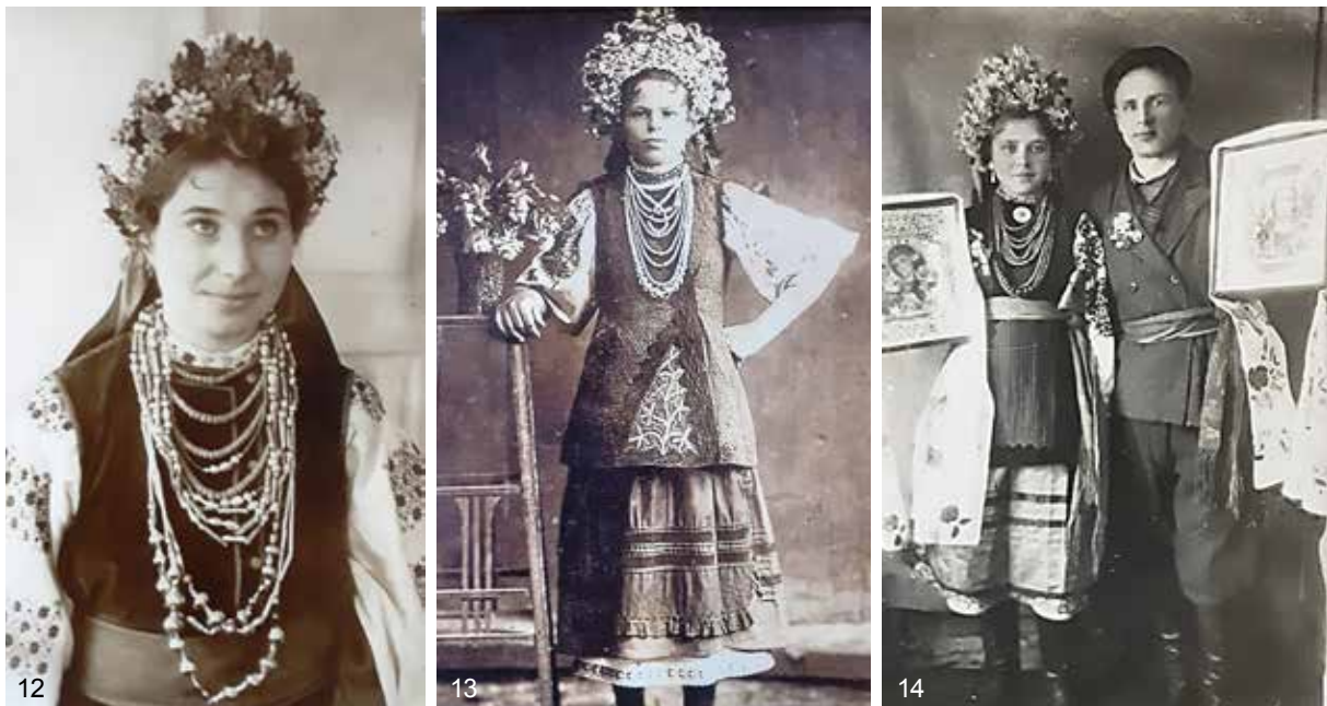
12–14. Весілля в с. Бобриця Бучанського р-ну Київської обл. 1930–1960-ті рр. З колекції Музею історії с. Бобриця. Світлина Л. Босої (2023 р.)