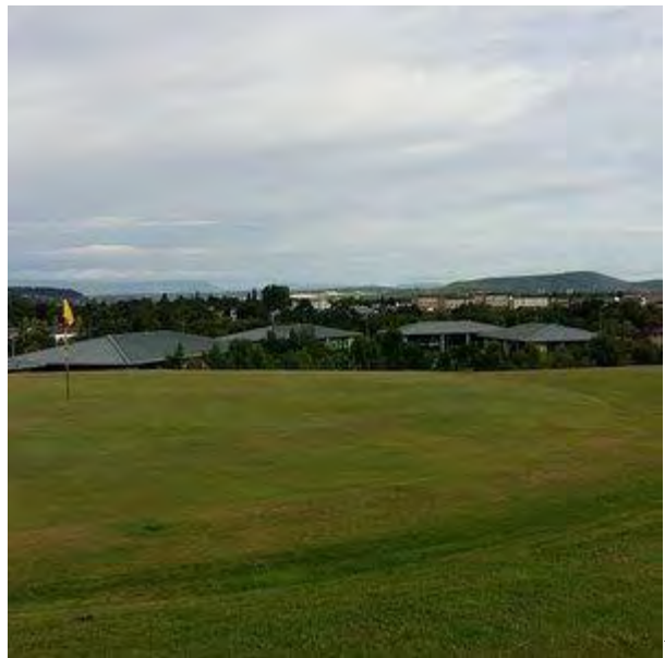
Рис. 14 а, б, в. Поле для гольфу Інвернесс.