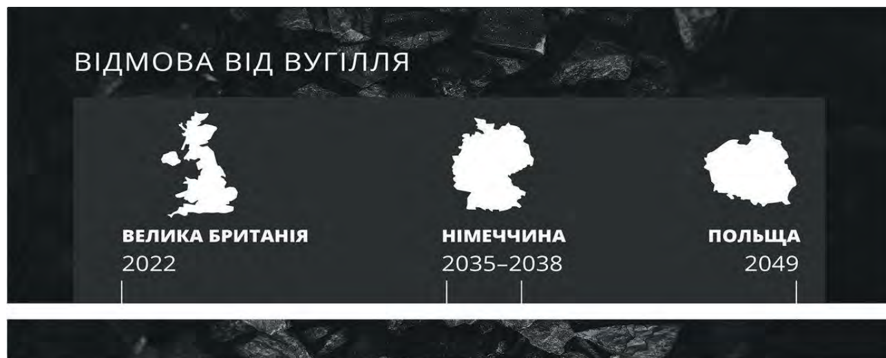
Рис. 1. Поступова відмова від вугілля країн Європи

Поступово країни Європи відмовляються від використання вугілля (рис. 1) та трансформують вуглевидобувні підприємства та регіони у різних економічних напрямках, повертаючи їм економічну привабливість.