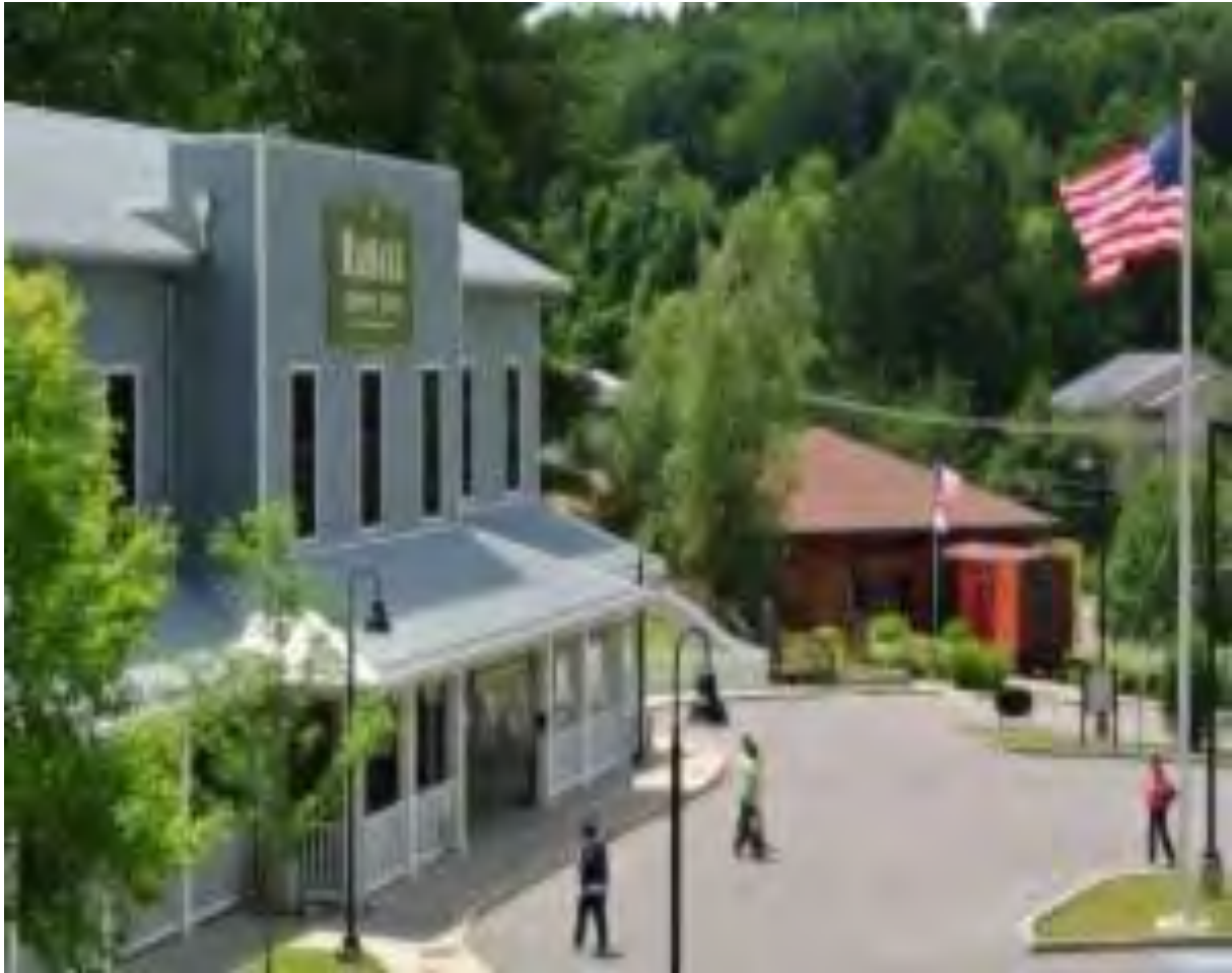
Рис. 11а. Exhibition coal mine and Youth museum