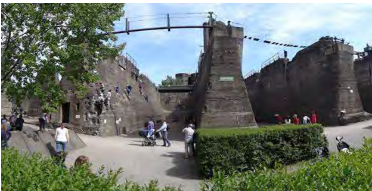
Рис. 7. Сьогодні: ландшафтний парк Дуйсбург-Норд