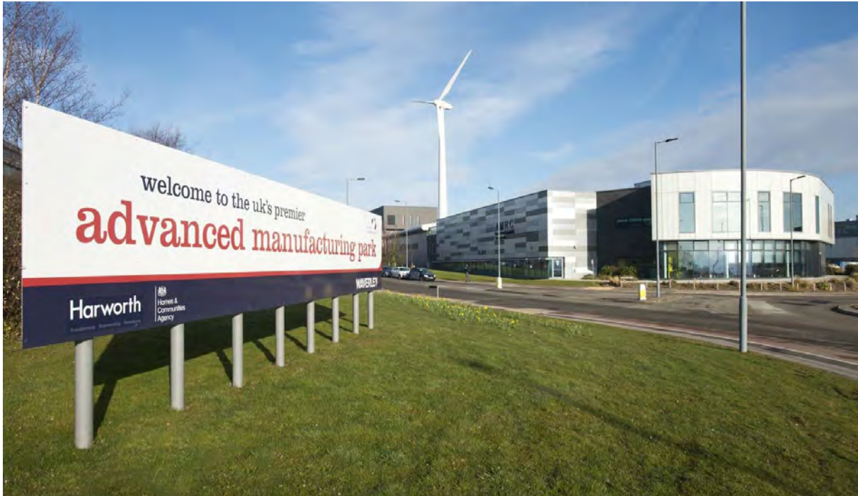
Рис. 10а. Advanced Manufacturing Park (AMP) - технологічний парк

Запуск парку відбувся в 2000-х на території однієї з покинутих шахт британського міста Ротерема. У технопарку Ротерема з'явилися дослідні офіси корпорацій «Боїнга» та «Роллс-Ройса», а також безліч компаній, що розробляють від новітніх медичних технологій до військових.