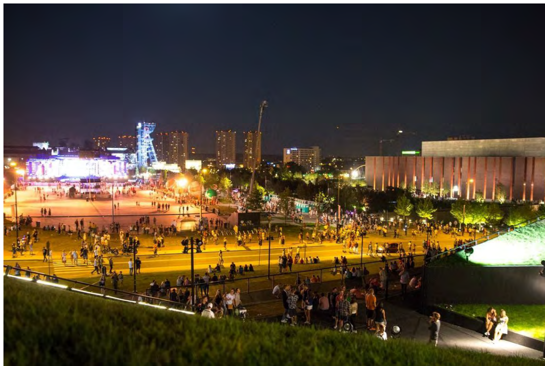
Рис. 16б. Катовіце. Зона культури

Чеська Республіка сьогодні перебуває на початку трансформаційного процесу відмови від видобутку та спалювання вугілля. Було вжито рішучих заходів для підтримки відповідних регіонів в частині розробки і реалізації стратегій економічної диверсифікації.