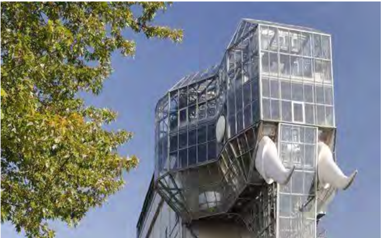
Рис. 8б. Сьогодні: Максимилянський парк (Гамм)