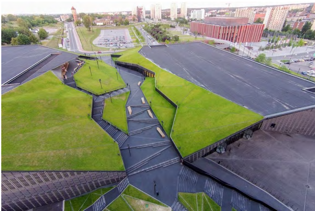
Рис. 16а. Катовіце. Зона культури