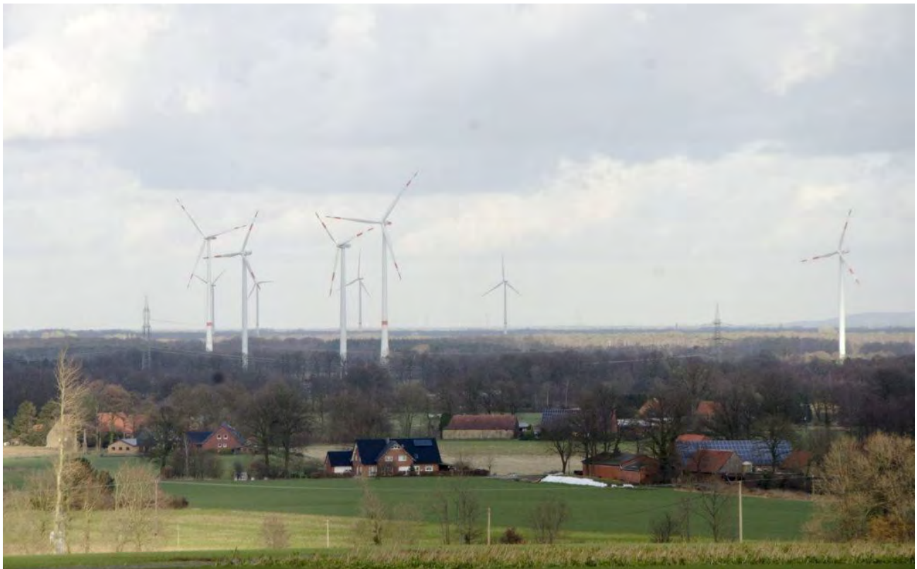
Рис. 4. Традиційний для сучасної Німеччини пейзаж.