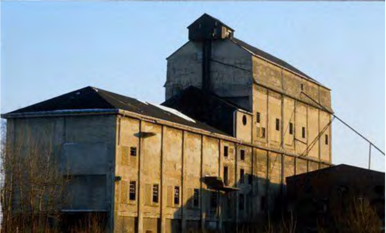
Рис. 8а. Раніше: шахта Zeche Maximilian (Гамм)