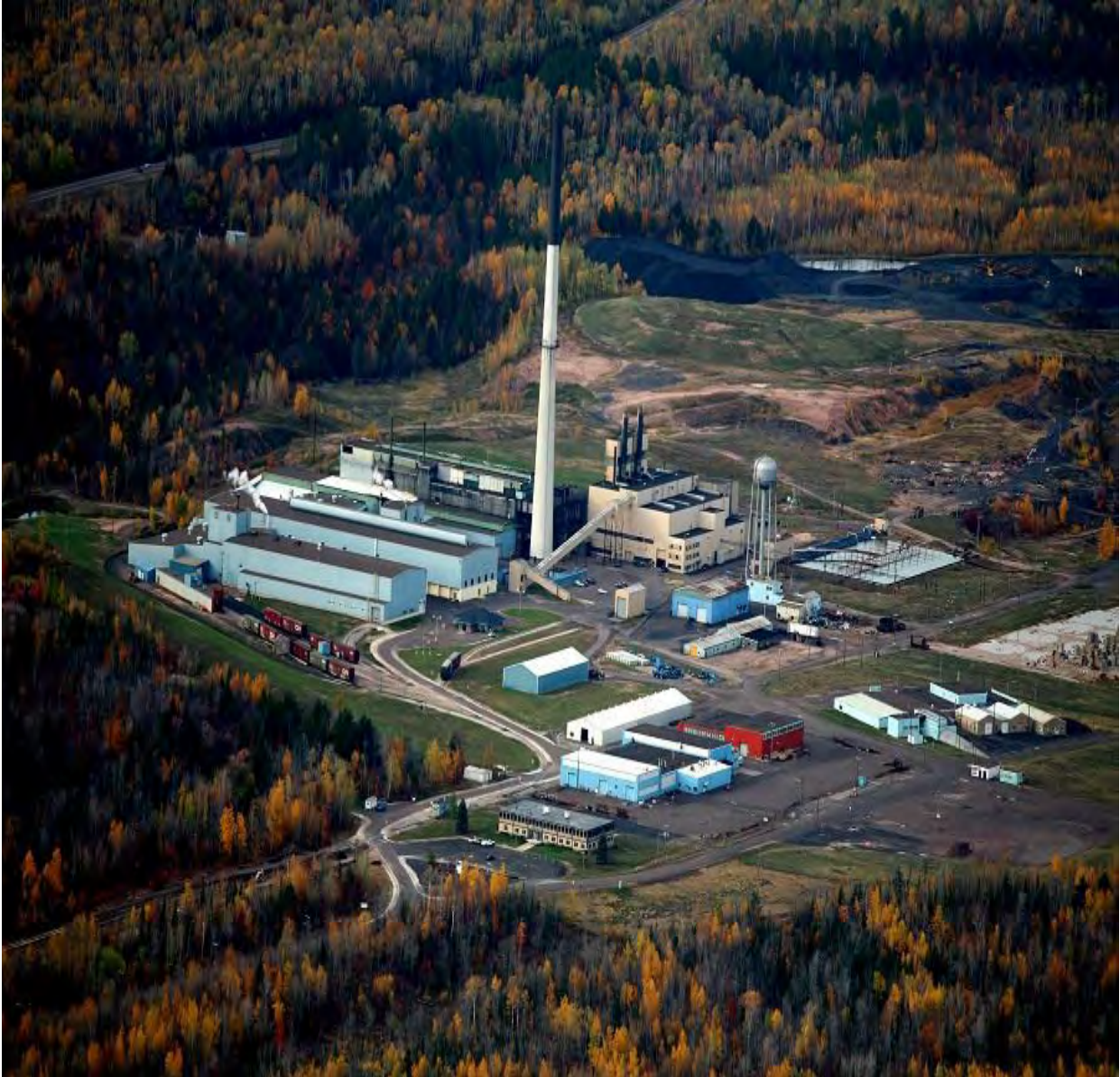
Рис. 13. Американська біотехнологічна компанія Prairie Plant Systems

Американська біотехнологічна компанія Prairie Plant Systems займається дослідженнями в біофармацевтиці і агросекторі яка працює як в США так і Канаді. Компанія розташована на кордоні США та Канади.