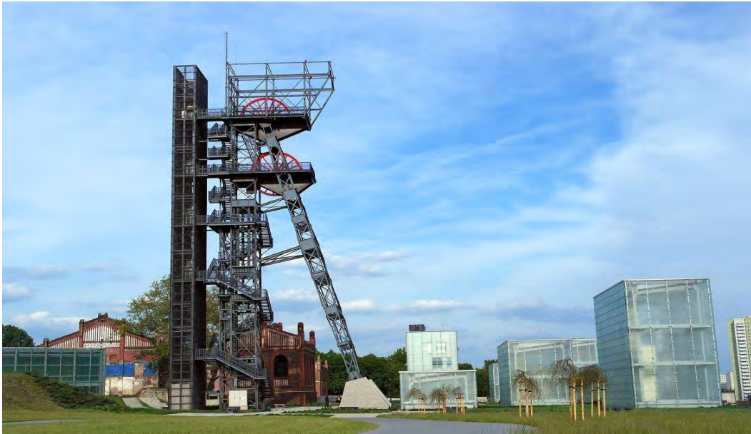
Рис. 15. Сілезький музей

В Польщі вже працюють шахти-музеї, які відомі у Європі (рис. 15, 16). Доцільно зазначити, що в Польщі створили ряд музеї-шахт (соляні, вугільні, крейдові).