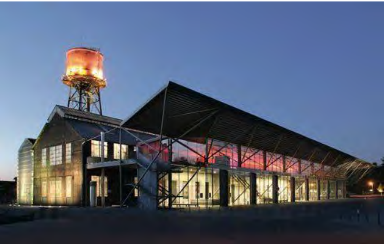
Рис. 9б. Сьогодні: Зал століття в Бохумі