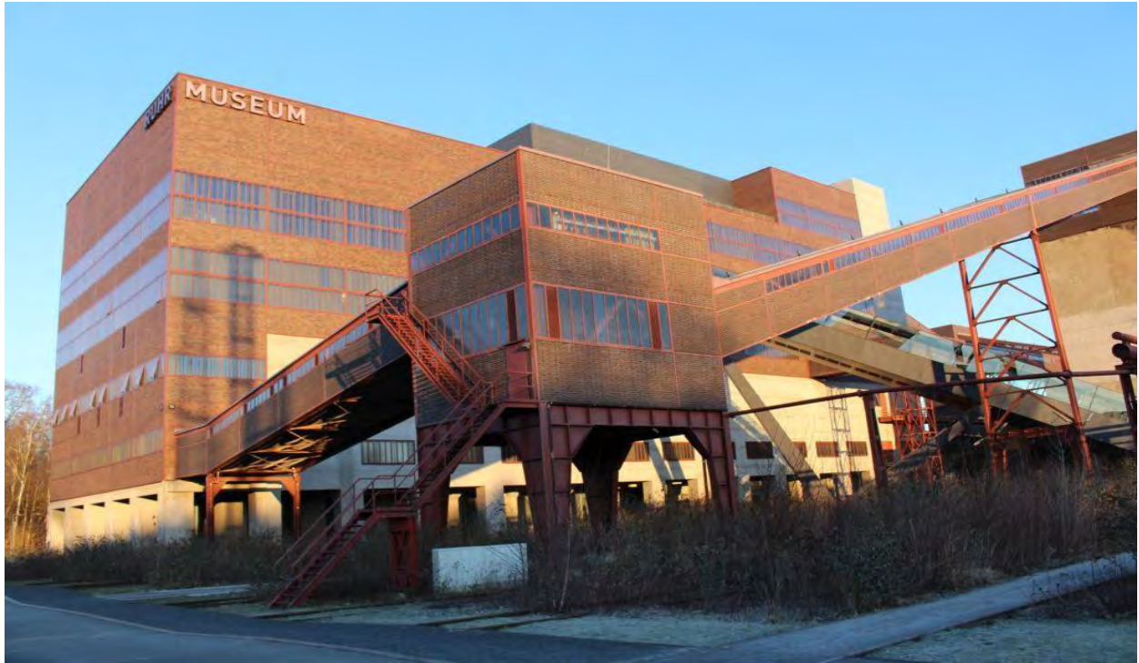
Рис. 3. Індустріальний музей «Цольферайн».