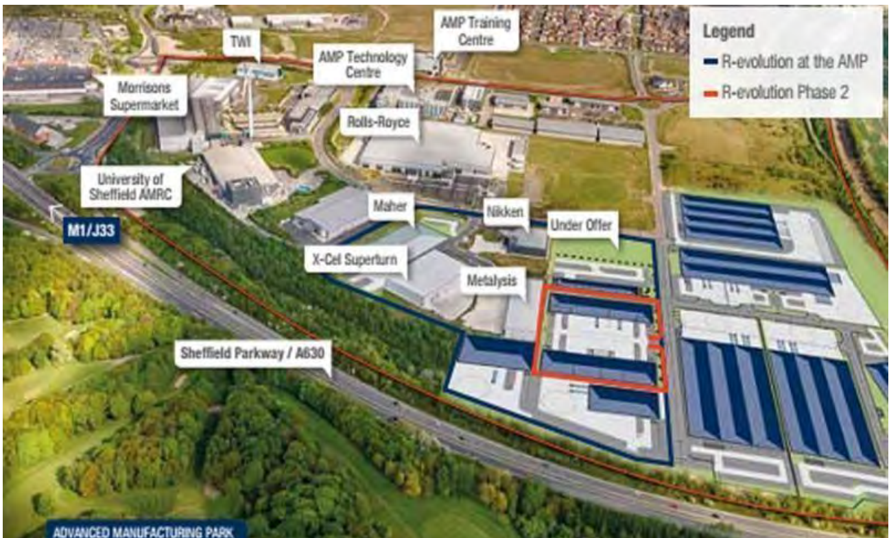
Рис. 10б. Advanced Manufacturing Park (AMP) - технологічний парк (план).