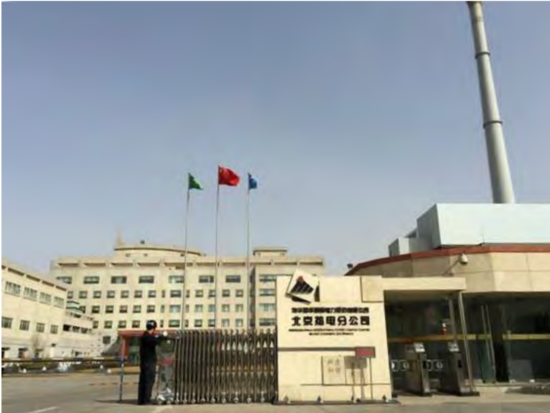
Рис. 18. Пекінська вугільна електростанція Guohua, Пекін

Українська вугільна галузь збиткова та дотаційна і потребує реформування. Трансформації потребують регіони, де історично займалися, переважно, видобуванням вугілля. Сьогодні в країні 65 міст, основним місцем працевлаштування у яких залишаються шахти. Наявний досвід закриття шахт в Україні свідчить, що воно проводилося без адекватних планів, соціально-економічної підтримки територій та призвело до виникнення комплексних негативних наслідків.