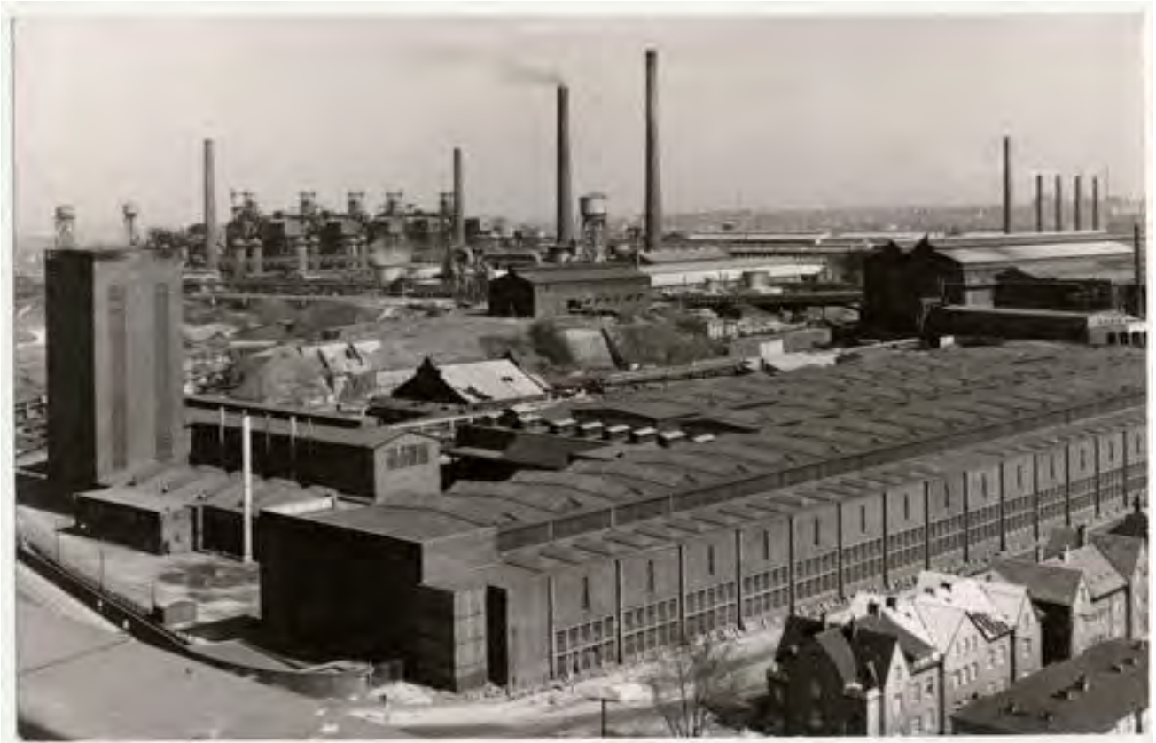
Рис. 9а. Раніше: Зал століття посеред промислового ареалу (Бохум)