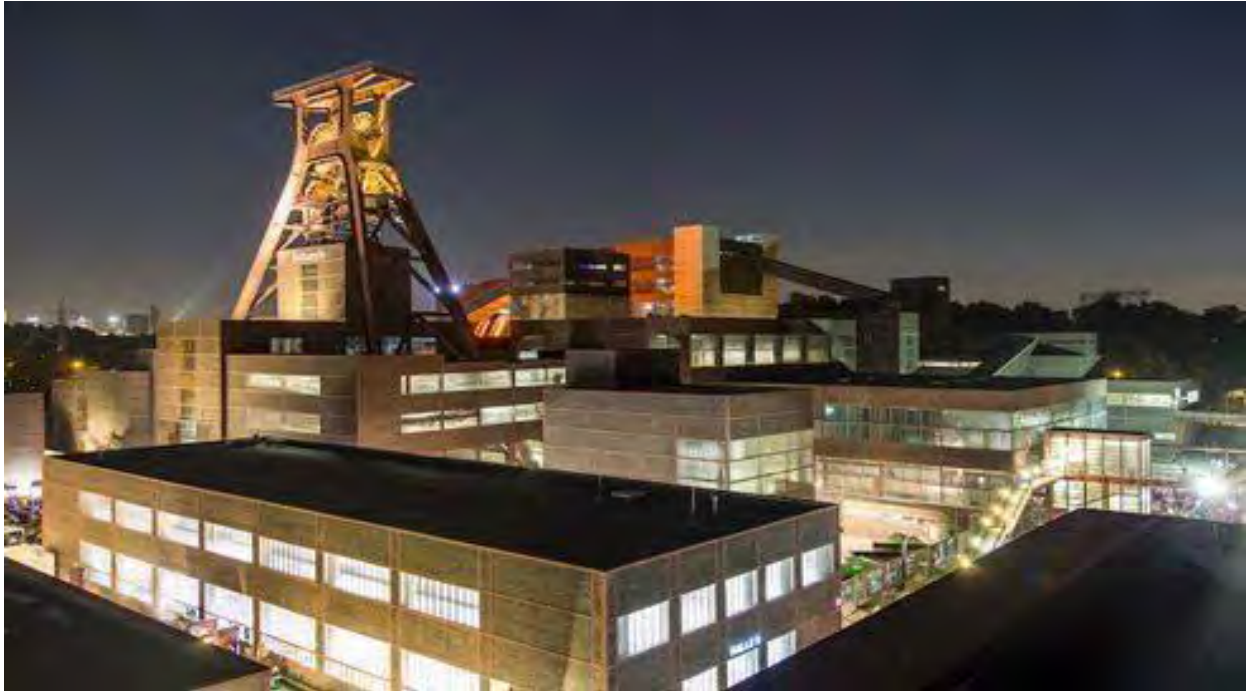
Рис. 6. Колишня шахта Zeche Zollverein влітку 2015 року; | © Jochen Tack / Stiftung Zollverein