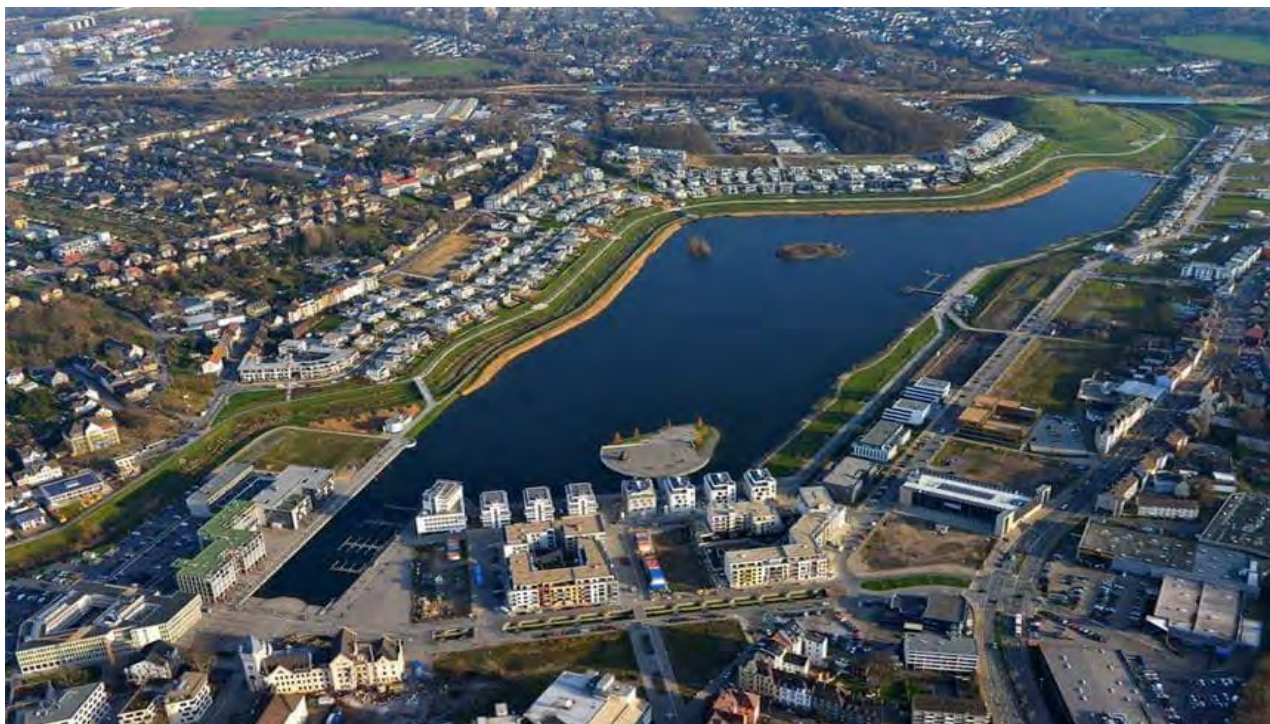
Рис. 5. Озеро «Фенікс» на місці металургійного комбінату.

У Німеччині була розроблена програма з санування і перепрофілювання великих вуглепромислових підприємств (рис. 5 - 9):