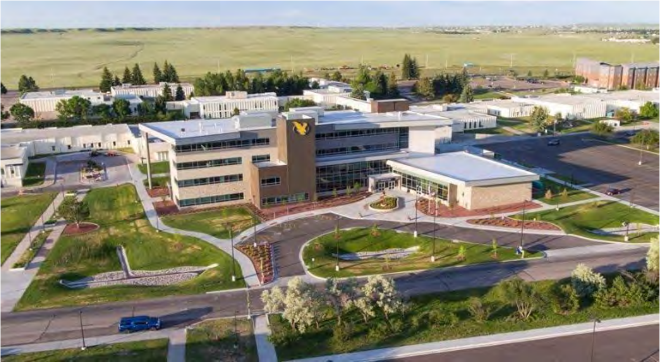
Рис. 10в. Advanced Manufacturing Park (AMP) - технологічний парк

У Великобританії результатом реновації вугільних підприємств стало створення більш 30-ти наукових технопарків, багато з яких тепер охороняються ЮНЕСКО.