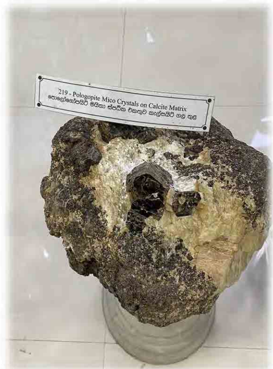
Fig. 28. Pologopite