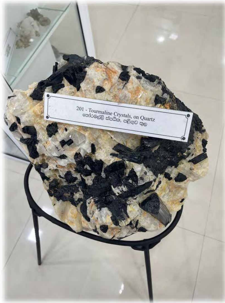
Fig. 24. Tourmaline crystals on quartz