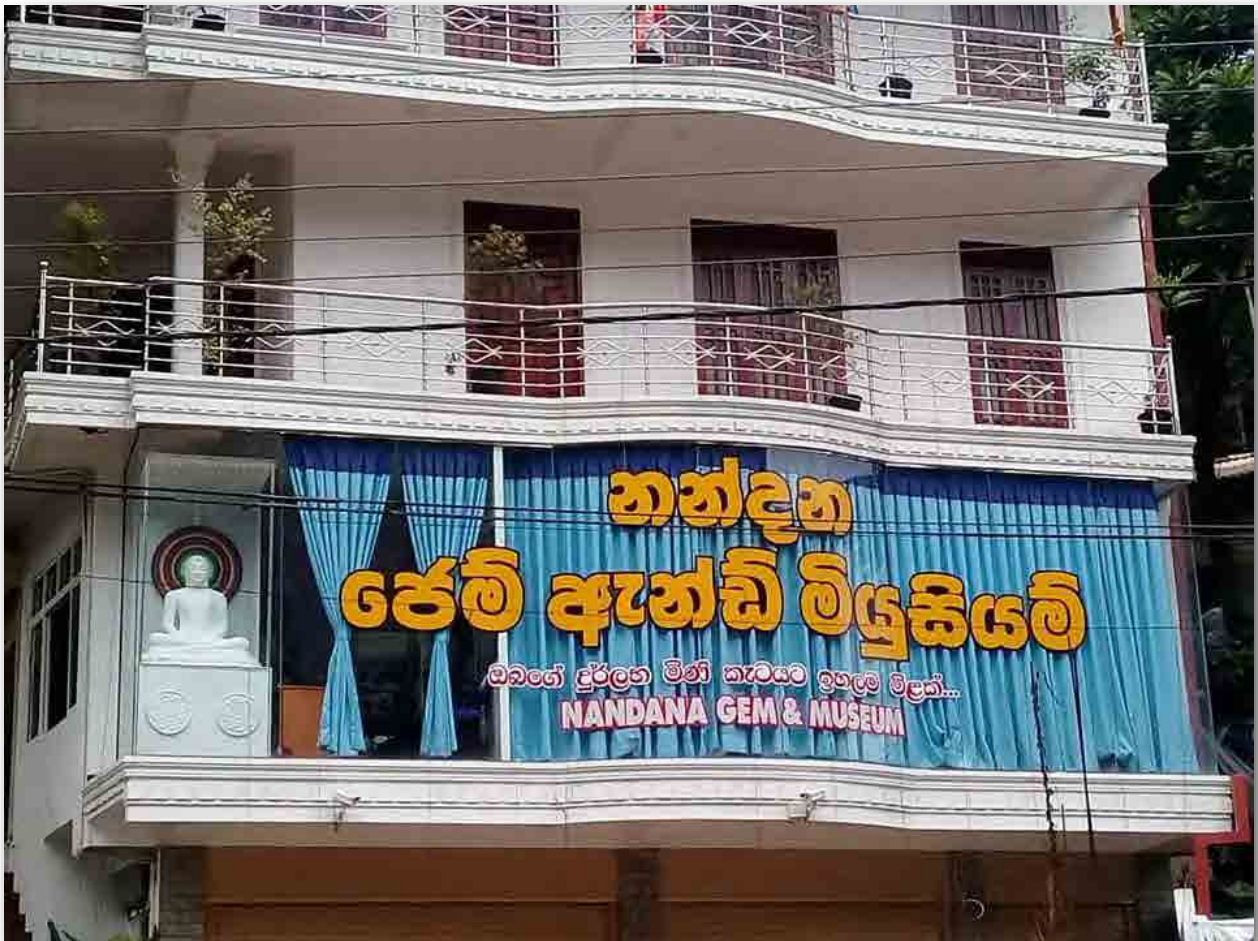
Fig. 2. NANDANA GEM & MUSEUM ( https://www.facebook.com/nandanagem.museum/ )

https://www.facebook.com/nandanagem.museum/