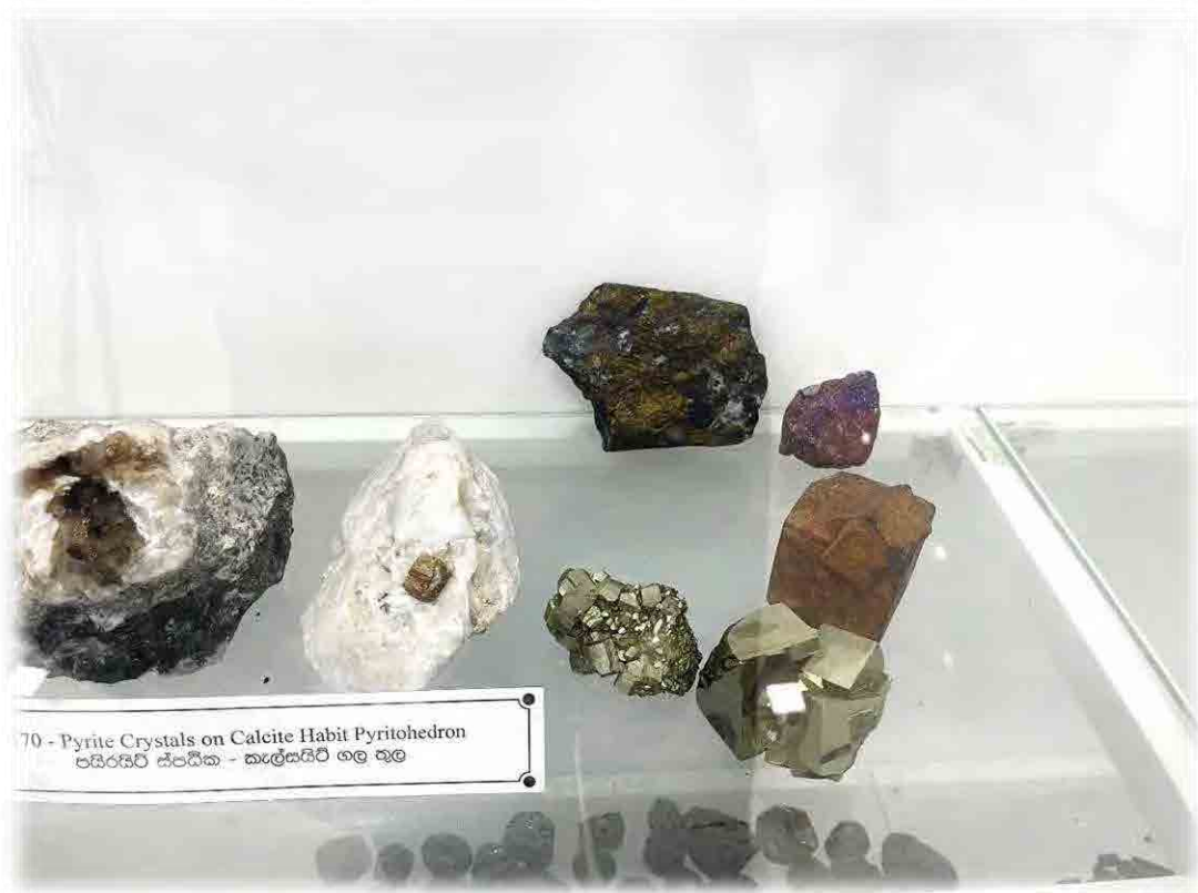
Fig. 23. Pyrites