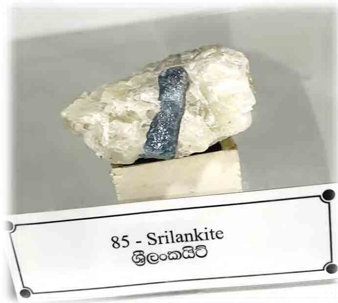
Fig. 25. Srilankite