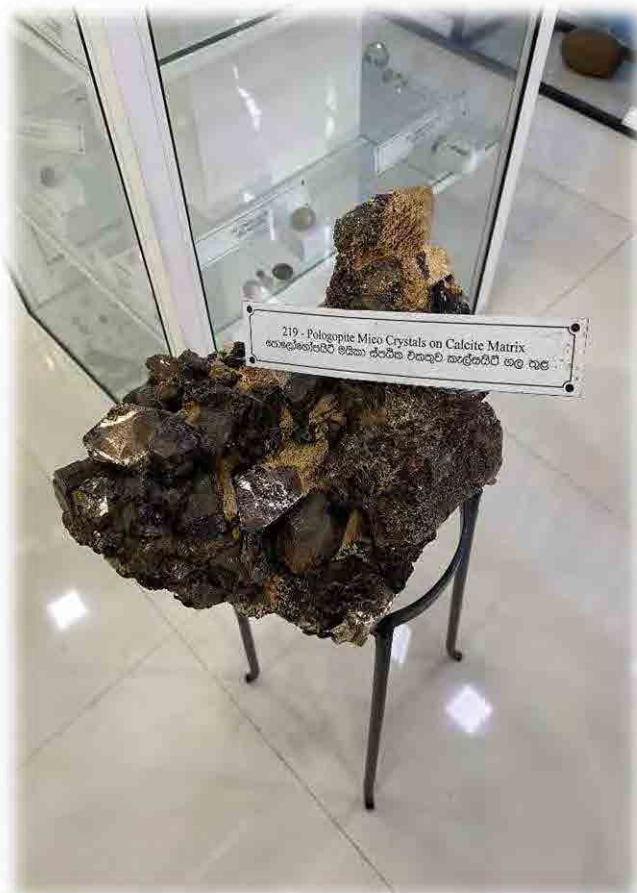
Fig. 27. Pologopite