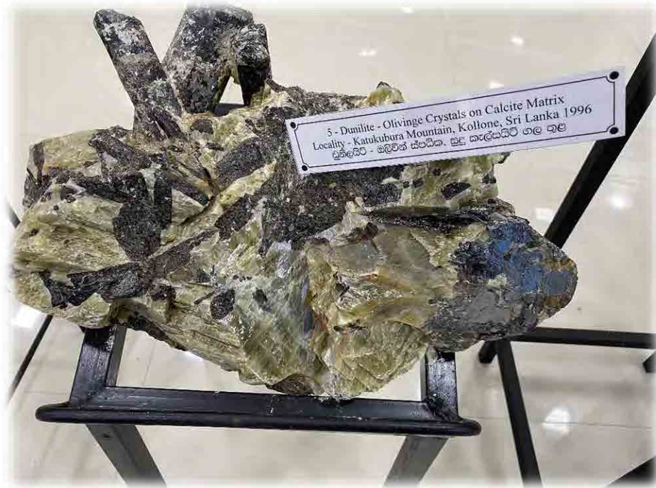
Fig. 26. Dunilite - Olivine Crystals