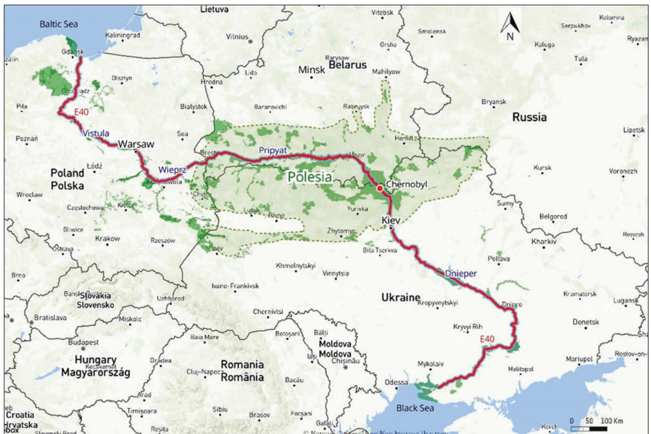
Рис. 1. Проект водного транспортного шляху E-40 від Балтійського (с. Gdansk) до Чорного моря (м. Херсон)

Негативні висновки надали також експерти наукових установ республіки білорусь. Хоча окремі беззаперечні, на думку експертів, докази шкідливості не витримують критики. Чому, наприклад, обов'язково по цій сучасній артерії довжиною близько 2000 км будуть ходити старі кораблі (як зазначено в екологічних висновках), від чого забруднення води істотно зростатиме? Для фахівців з гідрології та гідротехніки цілком очевидно, що