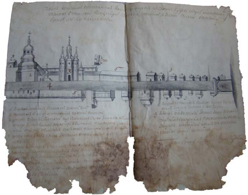
Малюнок-схема головної вулиці м. Лубни. 1758 р. ЦДІАК України. Ф. 51. Оп. 1. Спр. 1818.