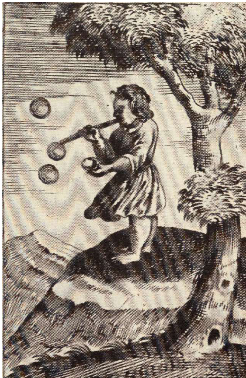
Ілюстрація до книги «Ифіка ієрополітика». 1760 р.