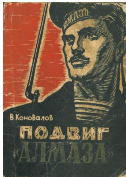
Подвиг Алмаза, 1963 р.

якраз у цей час взяли під контроль Бессарабію й просувалися в бік Одеси, що трактувалося у міському середовищі як реальна загроза збройного зіткнення.