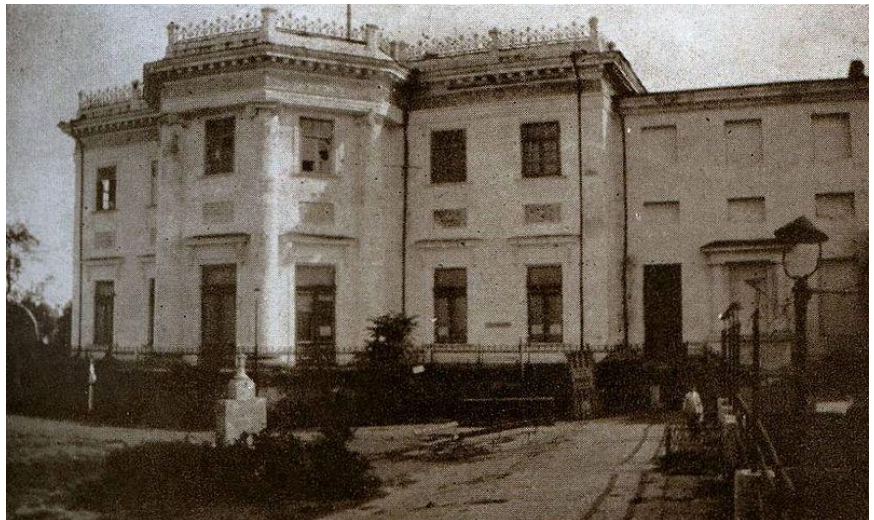
Воронцовський палац. 1927 рік