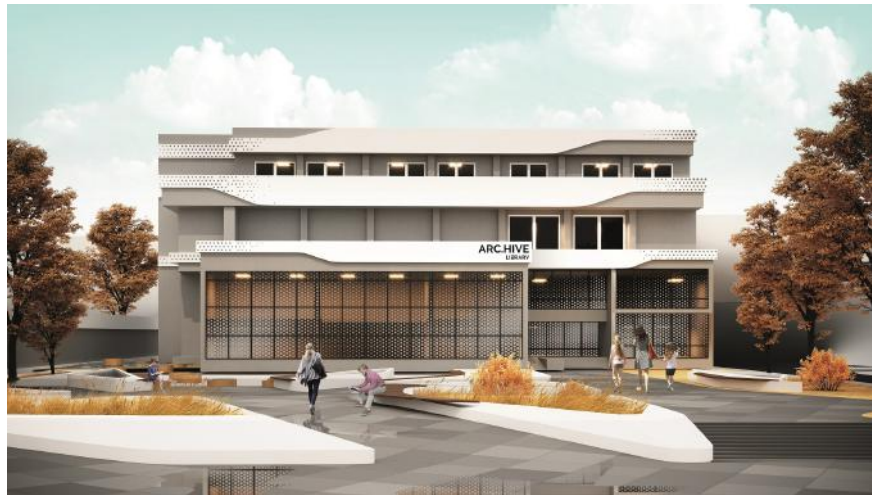
Фрагмент проекту команди «Arc.Hive»

розвитку відкритого простору території навколо бібліотеки для залучення більшої кількості користувачів».