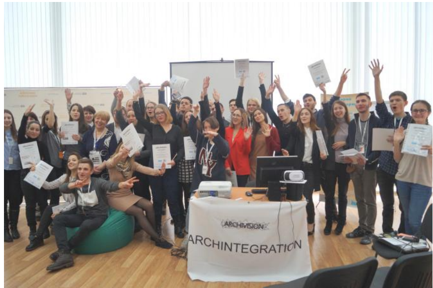
Фінал воркшопу ARCHINTEGRATION 2018

торії Софії Київської, де бібліотека функціонувала впродовж 41 року, потім 28 років знаходилась в Гостиному дворі на Подолі, і майже 5 років як розташувалась у сучасній чотириповерховій будівлі на Шулявці. Приміщення Митрополичого будинку і Гостиного двору були пристосовані до потреб бібліотеки, але зростання фонду та розширення функцій щоразу призводило до необхідності вирішення питання нової будівлі.