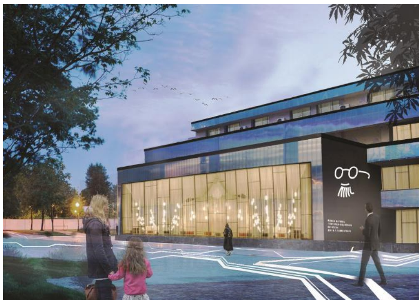
Фрагмент проекту команди «Very Well»

ні окуляри Заболотного, потім знайти знак вусів, від яких ведуть стежини до основних локацій. Ці символи ми заклали в логотипі, бренді, історії та дизайні».