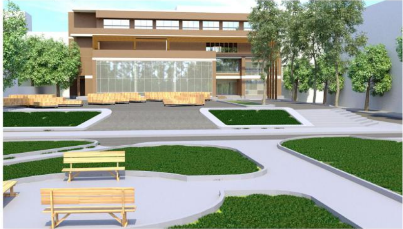
Фрагмент проекту команди «D&B»

ставила перед командами завдання – розробити дизайн-проекти та запропонувати планувальні рішення публічного простору ДНАББ ім. В. Г. Заболотного з метою задоволення потреб користувачів у комфортному просторі, як майданчика для реалізації ініціатив і місця проведення дозвілля.