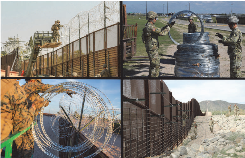
Фото 1. Типові фотографії структур зі зв'язків із громадськістю МО США демонструють військовослужбовців у засобах індивідуального захисту, без зброї, які виконують завдання із фортифікації кордону в листопаді 2018 р.

проте потрапив до журналістів газети «Newsweek». Відповідно до нього, нові правила дозволяли демонстрацію або застосування сили (зокрема летальної, за необхідності), контроль натовпу, тимчасове затримання і проведення поверхових обшуків. Це автоматично спричиняло юридичні дискусії щодо правомірності застосування ЗС і лімітів їхніх повноважень відповідно до Закону про Posse Comitatus (LaPorta, 2018). Міністр оборони США Дж. Меттіс, коментуючи документ, зазначив, що застосування ЗС не порушує дозволених законом межі, підрозділи не здійснюватимуть арешти і виконують інженерні роботи без штатної зброї. Він зазначав, що якщо війська використовуватимуть як додаткову захисну силу, то це будуть представники військової поліції, «озброєні щитами та кийками, без вогнепальної зброї», і вони зможуть тимчасово затримувати мігрантів для подальшої передачі правоохоронним органам лише за прямого нападу на прикордонників (Morgan, 2018).