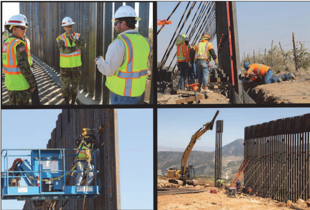
Фото 2. Типові фотографії структур із зв'язків із громадськістю МО США, сфокусовані на опосередкованій участі військовослужбовців у здійсненні прикордонних будівельних проєктів

З 2018 р. по 2020 р. Корпус інженерів армії США уклав контракти на суму понад 10 млрд дол. на будівництво південної прикордонної стіни. Більша частина цих грошей надійшла від МО. Відповідно до законів США, ці кошти повинні мали бути використані протягом фінансового року. Цей дедлайн змусив корпус швидко домовлятися з підрядниками, зокрема було укладено неконкурентних контрактів на суму 4,3 млрд дол. Окрім того, корпус дозволив кільком фірмам розпочати роботи зі зведення стіни, коли умови контракту ще обговорювали. Це не призводило до максимальної економії коштів, однак пришвидшувало терміни будівництва (Dickstein, 2018). На час закінчення терміну надзвичайного стану і зупинки робіт у січні 2021 р. корпус уклав контракти на будівництво понад 450 миль прикордонної стіни й інших бар'єрних загороджень. Рисунок 2 демонструє ділянки робіт, на зведення яких Корпус інженерів армії США уклав контракти протягом 2018–2020 ф. р. (DiNapoli, 2021).