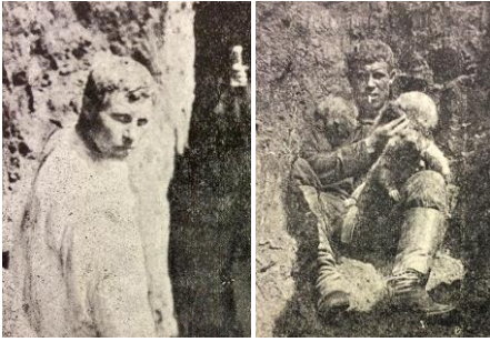
Рис. 2. На розкопках нір бабака у Стрільцівському степу. Фото зі статті Б. Виноградова про рийну діяльність бабака (Виноградов 1933), представлені в «Журналі біозоологічного циклу» (до речі, стаття написана українською). Хто саме на фото — не відомо, проте найімовірніше це сам Борис Виноградов. Редаговано.

Продовжуючи огляди шкідників сільського господарства з прогнозами динаміки їхньої чисельності, Б. Виноградов описав, поміж інших, строкаток степових ( Lagurus lagurus ) у фазі спалаху їхньої чисельності (Виноградов 1934), що закономірно випав на фазу розселення виду на захід.