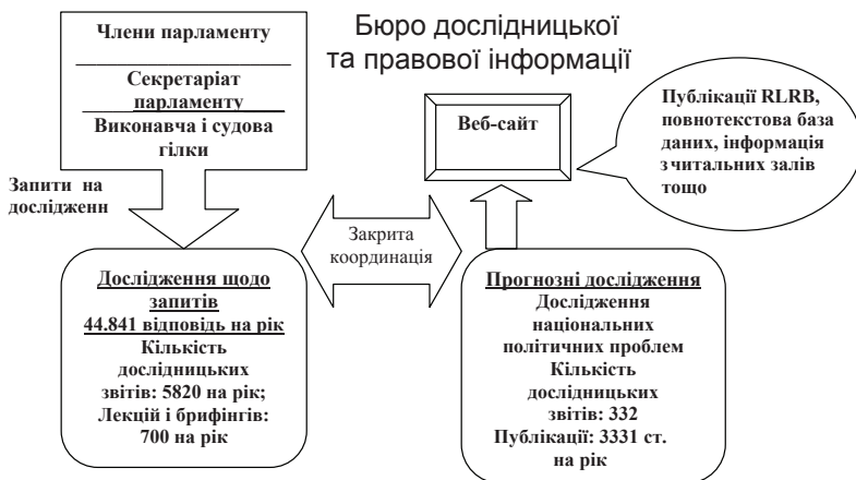
Рис. 2. Схема діяльності Бюро дослідницької та правової інформації Національної парламентської бібліотеки Японії

головним чином, через публікації та на веб-сайті бібліотеки. Співробітники бюро систематично вивчають проблемні питання, щодо яких у майбутньому ймовірно запити користувачів. Згідно з останніми статистичними даними, у виданнях, що випускаються RLRB, публікується в середньому 332 статті на рік загальною кількістю 3331 сторінок (рис. 2).