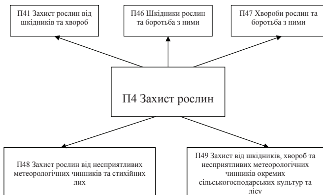
Рис. 1. Структура підрозділу «P4 Захист рослин» з досвіду Бібліотеки