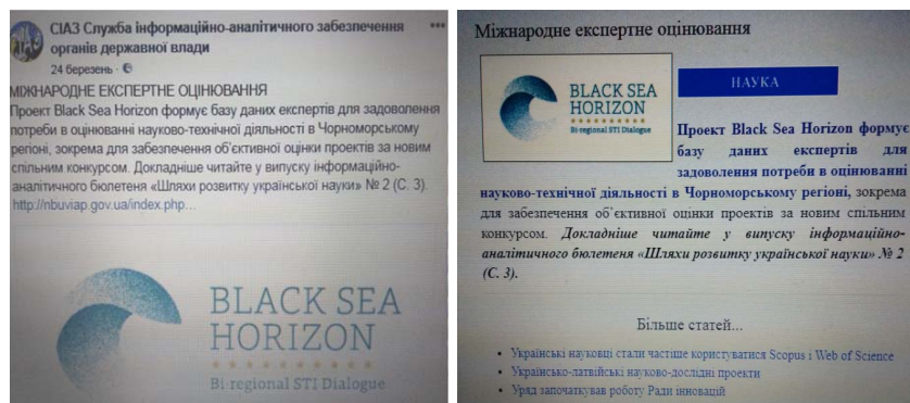
Рис. 4. Анонс зі сторінки CIA3 у Facebook ( https://www.facebook.com/siazua ) і на сайті ЦДСК ( http://nbuviap.gov.ua )

Як приклад ефективної діяльності в напрямі налагодження наукової комунікації між бібліотекою й користувачами можна розглядати розміщення на сторінці CIA3 у соціальній мережі Facebook анонсів видання «Шляхи розвитку української науки» – інформаційно-аналітичного бюлетеню, у якому висвітлюються проблеми підвищення ефективності наукової діяльності, проблеми реформування української науки; подається інформація про здобутки вітчизняної науки; висвітлюється досвід розвитку наукових досліджень за кордоном (рис. 4).