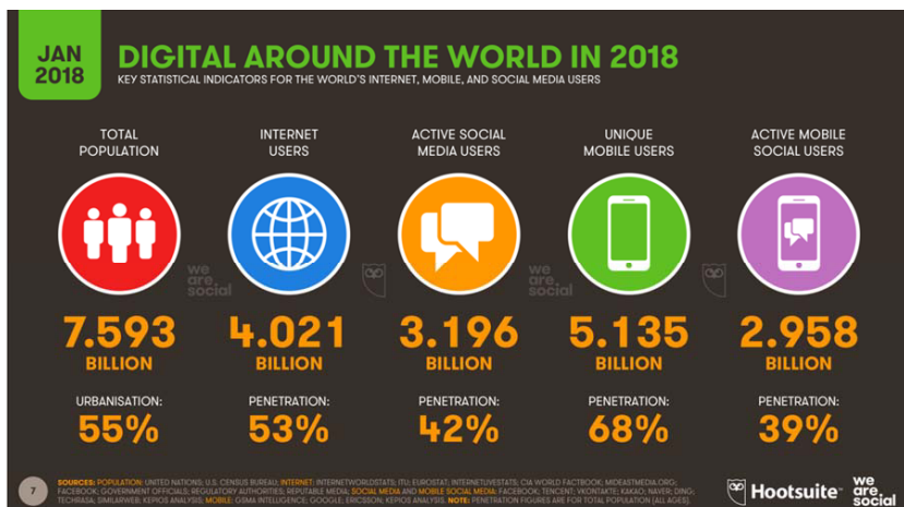
Рис. 1. Ключові статистичні показники для користувачів Інтернету, мобільних пристроїв і соціальних мереж світу

За даними дослідження, проведеного компаніями We Are Social і Hootsuite, сьогодні у світі понад 4 млрд осіб користуються Інтернетом. При цьому майже чверть мільярда нових користувачів з'явилися в Інтернеті вперше у 2017 р. Крім того, за цей рік збільшилася не тільки кількість користувачів, а й час, проведений онлайн: за останніми даними компанії GlobalWebIndex, у середньому люди так чи інакше користуються Інтернетом по 6 год на день.