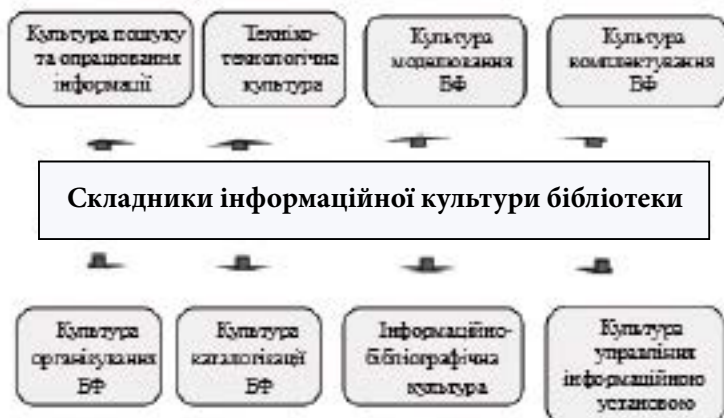
Рис. 2. Зведена схема складників інформаційної культури бібліотеки

процеси аналітико-синтетичного опрацювання документів, організації, ведення і редагування каталогів, управління їх системою і технічними процесами каталогізації. До складників ІКБ можна віднести культуру пошуку та опрацювання інформації, техніко-технологічну культуру і культуру управління бібліотекою, що продемонстровано на зведеній схемі складників ІКБ (рис. 2).