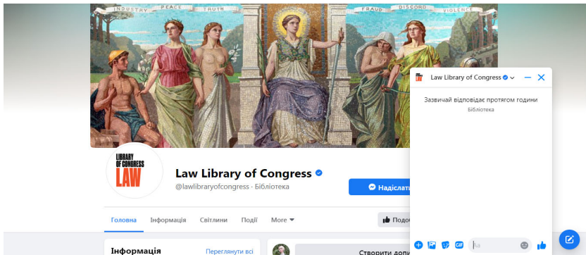
Рис. 2. Представленість чат-бота Бібліотеки Конгресу в соціальній мережі «Фейсбук».

гресу. Бібліотека також пропонує ознайомитись із блогом «Народне життя сьогодні», у якому більш детально представлено фольклорний контент. Важливим є те, що надається можливість підписатись на підкасти [22]. Так, бібліотека пропонує підкаст «Що надихає співробітників Американського фольклорного центру під час вірусної кризи» в межах проекту «Народне життя сьогодні». Бібліотека пропонує підкаст, у якому С. Вінік і Дж. Фенн розмовляють зі співробітниками Американського центру фольклорного життя про те, що надихає їх на колекції, коли вони працюють з дому у зв'язку з пандемією COVID-19.