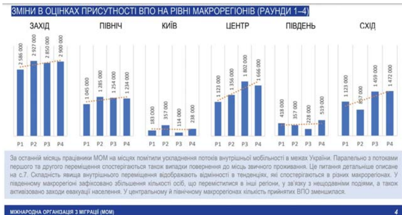
Рис. 1. Зміни в оцінках присутності ВПО у макрорегіонах України (16.03–03.05.2022 р.)

Зазначена інформативність звітів МОМ особливо актуальна через недостатність, а інколи й повну відсутність статистичних матеріалів щодо ВПО українських органів влади і місцевого самоврядування, особливо у перші місяці повномасштабного російського вторгнення в Україну.