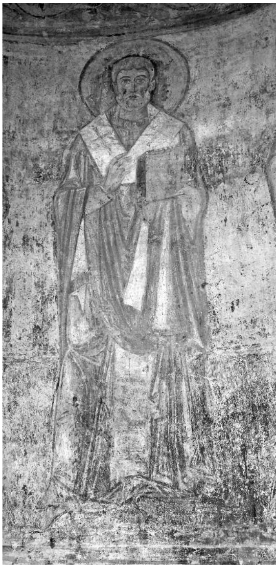
Мал. 2. Фресковий образ св. Мартина, Папи Римського. Георгіївський приділ Софійського собору

Подібно мозаїчному “Святительському чину” центральної апсиди, фресковий “Святительський чин” Георгіївського вівтаря починає образ св. Епіфанія Кіпрського. Його образ був обраний завдяки хронологічному збігові дня пам’яті цього святителя з днем освячення “материнської церкви” (ecclesia matrix) Русі – Богородиці Десятинної (12/25 травня), позаяк такі факти набирали сакрального значення. Саме тому в ряду визначних представників Вселенської Церкви першим поставлений той святитель, день пам’яті якого розпочинає хронологічний відлік історії Руської Церкви 24 .