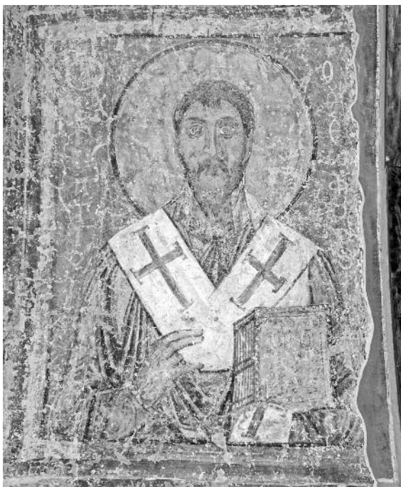
Мал. 3. Фресковий образ св. Ігнатія Богоносця. Південна внутрішня галерея Софійського собору

іншою версією – третім після єпископа Евода, святого апостола від 70-ти). На Антіохійській кафедрі він був приблизно з 68 р. Св. Йоанн Златоуст у “Похвальному слові Ігнатію” стверджує, що він “близько спілкувався з апостолами”, “з ними виховувався і скрізь при них перебував”, що влада єпископства була вручена йому святими апостолами і “руки блаженних апостолів торкалися священної глави його”. Блаженний Єроним у своїй “Хроніці” зараховує св. Ігнатія до слухачів і учнів св. Йоанна Богослова. Можна припустити, що в молоді роки св. Ігнатій був знайомий зі свв. апостолами Петром і Павлом, які проповідували в Антіохії.