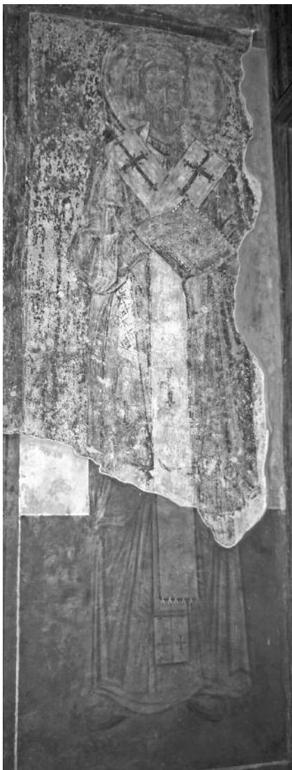
Мал. 3. Фресковий образ св. Капітона. Південна внутрішня галерея Софійського собору

швидко поширився у древній Церкві. Цей знаменитий святий – автор цілого корпусу послань, написаних до малоазійських Церков і пронизаних лейтмотивом єдності Церкви. Св. Ігнатій Богоносець помер мученицькою смертю в Римі за імператора Траяна, який наказав кинути його на розтерзання звірам. Вірні збирали кості св. Ігнатія і поховали у Римі. Традиційно дату мученицької кончини позначають 107 р., але дослідники схиляються до більш пізньої дати (110–117 рр.). Згодом святі мощі відіслали до Антіохії, де їх поховали у храмі на дафнійському передмісті. У 450 р. святі мощі перенесли до нової церкви, збудованої на місці зруйнованого язичницького храму богині Фортуни. Мощі св. Ігнатія прославилися численними чудесами. У середині VII ст. їх перенесли до Рима в церкву св. Климента 41 .