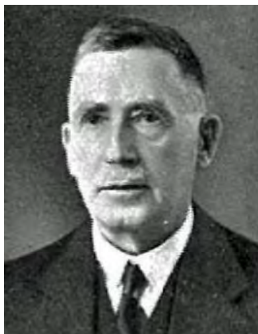
Томас-Роберт Баррер (1863–1952).

ферми. Звідти було 100 кілометрів на південь до Веллінгтона. Томас-Роберт Баррер кілька років числився в складі Веллінгтонської портової ради і навіть очолював її у 1934–1936 роках як 26-й з черги голова.