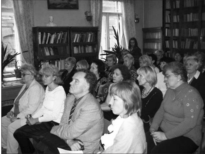
Під час конференції, присвяченої 70-річчю діяльності Львівської обласної наукової медичної бібліотеки