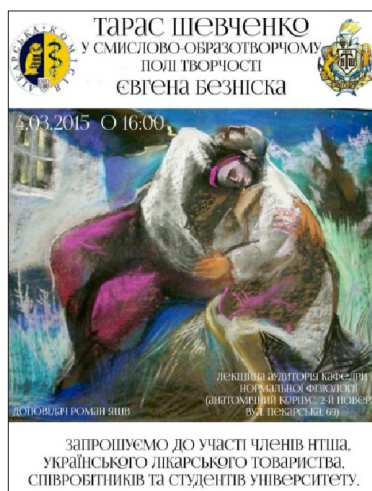
Рис. 6. «Шевченкіана медика–2015», присвячена творчому доробку Євгена Безніска

4 березня 2015 року в приміщенні кафедри нормальної фізіології медуніверситету відбулось третє засідання Лікарської комісії Наукового Товариства ім. Шевченка «Шевченкіана медика – 2015». Зустріч розпочали з вшанування пам'яті Михайла Вербицького, автора національного та державного гімну, у день його 200-річчя з дня народження хвилиною мовчання та перегляду фільму про творчість народного художника України, лауреата Національної премії Тараса Шевченка Євгена Безніска*. Згодом заслухали доповідь мистецтвознавця, проректора з наукової роботи Львівської національної академії мистецтв, професора Романа Яціва на тему «Тарас Шевченко – у смислово-образотворчому полі творчості Євгена Безніска». Також на