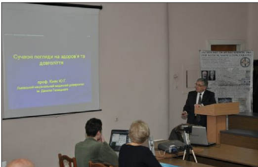
Рис. 4. Лекція проф. Ю. Кияка

з 2006 р.) та запросив присутніх на конференції науковців до подальшої співпраці. Засідання продовжив завідувач кафедри сімейної медицини ФПДО, професор Юліан Кияк із доповіддю на тему «Сучасний погляд на здоров'я та довголіття» (рис. 4). Свій виступив професор розпочав такими словами «Глобальне постаріння – це чудесне благословення, бо головне бажання кожної людини жити довше – вже здійснюється».