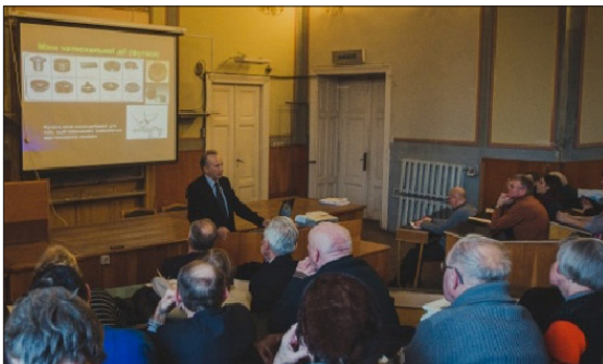
Рис. 2. Доповідь проф. І. Трутяка «Сучасна бойова травма»

ортопедії ЛНМУ імені Данила Галицького, професора Ігора Трутяка «Сучасна бойова травма» (рис. 2). Доповіді зацікавили слухачів. І це не дивно, адже тривалий час українці перебувають в стані хронічного стресу – Євромайдан і Революція гідності, Небесна сотня, анексія Криму, АТО і жахлива війна на сході країни.