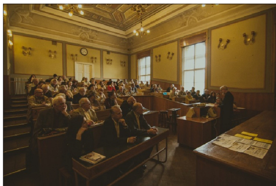
Рис. 10. Під час засідання, присвяченого 150-річчю від дня народження митрополита Андрея Шептицького

Традиційно засідання розпочала голова ЛК НТШ професор Заячківська О. С., яка розповіла про постать Митрополита Андрея Шептицького, його місце в культурі України та непересічні заслуги. Митрополит був щедрим меценатом, людиною з тонким почуттям краси і малярським хистом. Він невтомно розшукував і відновлював мистецькі твори, повертав окремі з них на батьківщину, викуповуючи за кордоном, та передавав їх до фондової колекції його дітища – Національного музею у Львові. Всіляко підтримував розвиток тогочасного мистецтва, медицини та науки, залишив багату культурну спадщину.