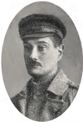
Рис. 4. Доц. Александр Домашевич (1887–1948)

зацію з нейрохірургії у Відні, Парижі, Стокгольмі, Берліні, Лондоні. З 1922 до 1933 року був завідувачем психоневрологічного відділення, яке розташувалось по вулиці Пекарській (50 неврологічних і 30 психіатричних ліжок), зараз будівля належить військовому шпиталю. Доцент, керівник курсу нейрохірургії кафедри шпитальної хірургії Львівського державного медичного інституту (ЛДМІ) (1940-1941), керівник Варшавської клініки нейрохірургії. У 1930 році організував у Львові перше нейрохірургічне відділення на 20 ліжок, у тогочасній Польщі вперше виконав нейрохірургічні операції високого рівня складності. Автор понад 20 наукових праць [13].