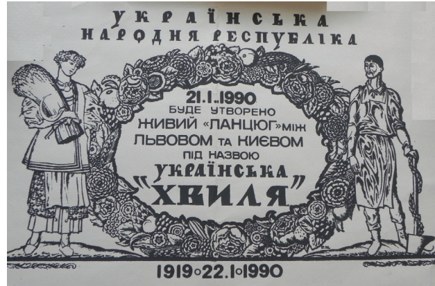
Рис. 4. Афіша «Української хвилі» у 1990 році

Члени ЛК НТШ взяли активну участь в «Українській хвилі» на честь Злуки ЗУНР і УНР, забезпечуючи нерозривність живого ланцюга на Золочівській частині траси (рис. 4).