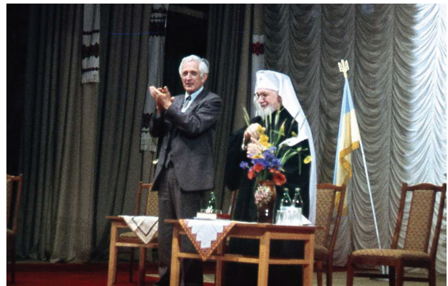
Рис. 6. На Урочистій Академії на пошану Митрополита Андрея Шептицького, Львів, 1990 р.

почесного члена НТШ митрополита Андрея Шептицького. Конференція готувалася в обстановці строгої секретності. До організації Урочистої Академії залучено, окрім ЛК НТШ, регіональну організацію «Меморіал», комітет захисту УГКЦ та товариство «Милосердя» (рис.6) Дійсний член НТШ, ректор професор Павловський дозволив провести захід в актовому залі Львівського медичного інституту. Оголошення про захід розповсюджено Львовом після обіду 3 травня (рис.7)