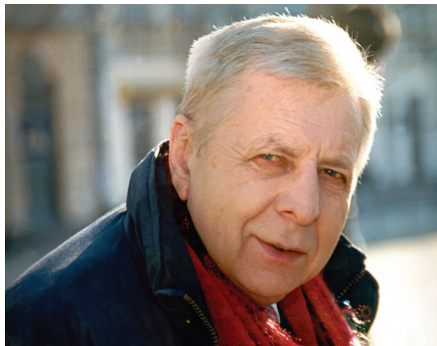
Рис. 2. Перший голова Наукового Товариства імені Шевченка, професор Олег Романів

Головою відродженого НТШ обрано члена-кореспондента АН України Олега Романіва (рис. 2) його заступниками – Юлія Бабея та Ярослава Ісаєвича. Головою лікарської комісії обрано професора Ярослава Ганіткевича (Скочій, Кіцера, 1989; Падох, 1990) (рис. 3).