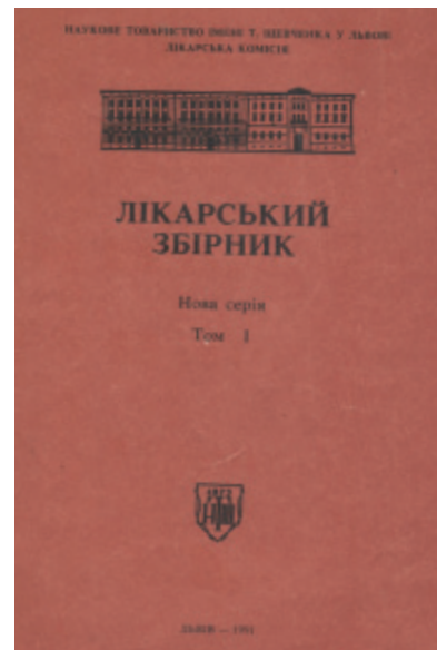
Рис. 10. Обкладинка 1 числа нової серії «Лікарського збірника», 1991 р.

Збірник містив Відозву до лікарської громадськості, 9 наукових статей, огляд, три статті з історії НТШ та УЛТ, матеріали «Із спадщини НТШ, 8 ювілейних статей, хроніку подій та «Наш календар» (Лікарський Збірник, 1991).