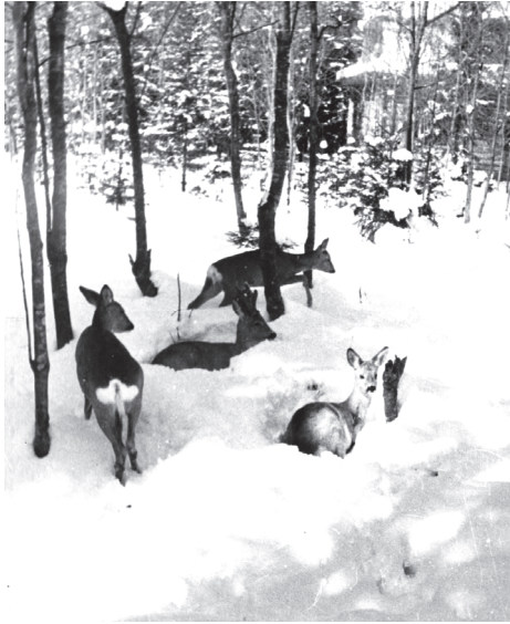
Сарна європейська в ур. Кам'яна (грудень 1969 р., окол. с. Кам'яна, Сторожинецький р-н, Чернівецька обл.).