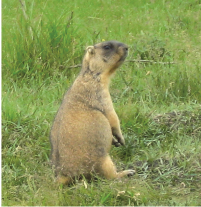
Рис. 2. Сурок степной ( Marmota bobak ) в зоне экологического оптимума — умеренно сбитые склоны балки в окрестностях заповедника (Окненный яр).

Fig. 2. Steppe Marmot ( Marmota bobak ) in the ecological optimum zone — moderately downed slopes of the beam in the reserve's vicinity (Okneny Yar).