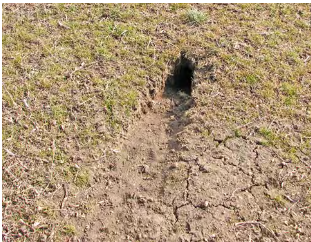
Рис. 1. Нора тушканчика, окр. с. Касьяновка (пункт 13 в табл. 1), Фото А. Бронскова.

С 2006 по 2014 г. автомобильными и пешими маршрутами была охвачена практически вся территория донецкого Приазовья. Менее обследованной оказалась остальная территория Донецкой обл. В подходящих условиях велся поиск животных или характерных для тушканчика нор. Учитывалось количество нор на полосе шириной 10 м и затем, в зависимости от длины маршрута, рассчитывалась плотность. Для пересчета на количество особей принято, что на одного зверька приходится одна нора (Селюнина, 2008 б). Результаты фиксировались фотоаппаратом (напр. см. рис. 1). При помощи GPS-навигатора места обнаружения животных или нор наносились на карту. Картографическая информация обрабатывалась при помощи свободного программного обеспечения QGIS.