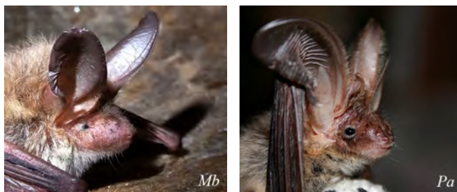
Рис. 3. Голови Myotis bechsteinii ( Mb ) та Plecotus auritus ( Pa ) та відмінності у розмірах та формі вух, очей, ніздрів.

Цей феномен виникає, якщо при визначенні матеріалу дослідники послуговуються шаблонами, ігноруючи можливість виявлення рідкісних видів. Тому описи складу локальних фаун можуть нести відбиток недообліку раритетів, при тому не через рідкісність останніх, а через помилкове віднесення їх до більш звичайних видів. Проте уважне ставлення до матеріалу дозволяє бачити такі відмінності, звичайно доволі значні (рис. 3), якщо тільки на це є час і дослідник постійно перевіряє себе і матеріал. Сумніви важливі. Псевдодвійниковість реальна. Відсутність певного виду у складі місцевої фауни може бути результатом помилок внаслідок шаблонних ідентифікацій (напр. довговухий кажан → Plecotus ), через що цінні знахідки рідкісних видів можуть бути віднесені до інших більш звичайних видів.