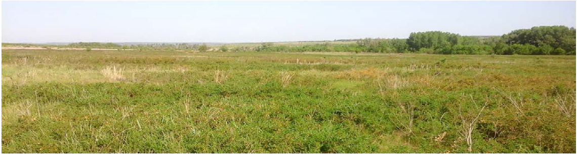
Рис. 1. Сучасний вигляд рослинного покриву: на передньому плані зарості карагани.