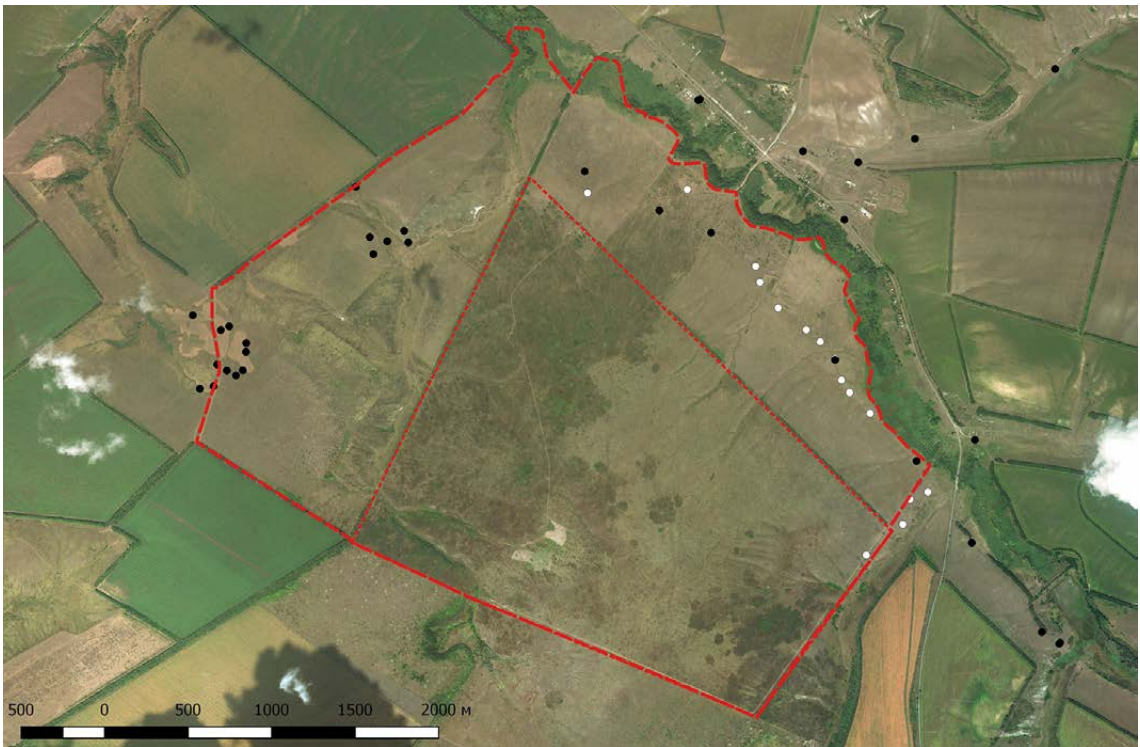
Рис. 4. Територія заповідника з осередками бабака на травень 2018 року (світлим кольором показані сімейні родини, що зникли протягом останніх 5 років).

Особливо катастрофічним зниження відбулося протягом останніх трьох років (2016–2018). Із 20 сімей, що проживали в долині р. Черпаха, на травень 2018 р. залишилося лише 4, і в них проживає лише по 1–2 особини. Без втручання людини ці родини також зникнуть. Всього на території заповідника збереглися до 20 родин, які сконцентровані на периферії, трьома осередками (рис. 4). В таблиці 1 наведено координати цих поселень.