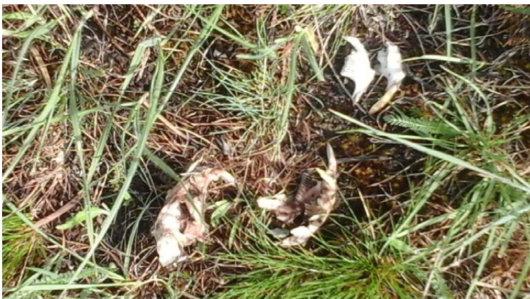
Рис. 5. Біля гнізді круків на високовольтній лінії біля сім'ї бабаків № 3 знайшли рештки двох черепів бабачат.

Якщо тенденції погіршення умов проживання бабака збережуться, то за відсутності пресу хижаків продовжить змінюватися і віковий склад сімей. Прибулих не буде або смертність у виводках становитиме 100 %. Така ситуація характерна для всієї старої території заповідника Стрільцівський степ, і падіння чисельності внаслідок старіння популяції носить катастрофічний характер. Протягом 1–2 років бабак зникає на площі сотень гектарів (Боровик, 2006). За участю великих хижаків або браконьєрства процес йде швидше (Боровик, 2014). Найбільш істотний вплив на популяцію бабака роблять свійські пси, а також вовки і лиси. Особливо цей вплив відчувається при фрагментації ареалу бабака та його поселень.