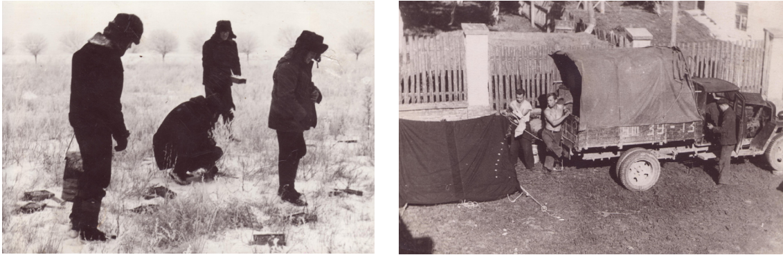
Рис. 2. Робота відділу екології ІЗАН в асканійському степу: ліворуч — виставляння пасток на дрібних ссавців у цілинному степу (обліки проводилися в усі чотири сезони року), праворуч — табір в селищі Асканія-Нова.

Fig. 2. The work of the ecology department of IZAN in the Askanian steppe: on the left —trapping of small mammals in the virgin steppe (census of small mammals were carried out in all four seasons of the year), on the right — a camp in Askania-Nova settlement.