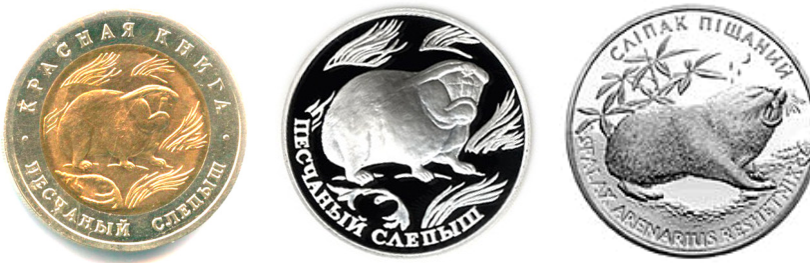
Рис. 7. Українська «сліпачова» монета (2005) та її російські «попередники» 1994 та 1996 років.

Fig. 6. Comparison of Ukrainian "bison" coins with analogues, as "predecessors" as "followers". Top row: Russian 1994 and 1997, Ukrainian 2003; bottom row: Belarusian 2012 silver with a face value of "20 rubles", Belarusian 2012 gold with diamonds with a face value of "20 rubles", Polish 2013 with a face value of "2 zloty".