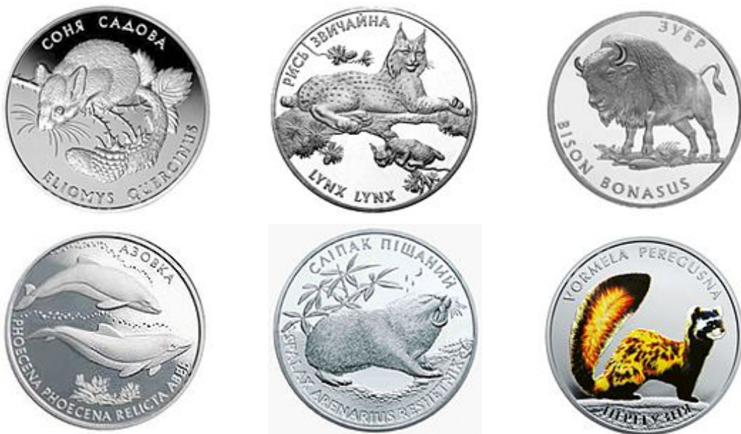
Рис. 1. Реверси монет з серії «Флора і фауна» (за зображеннями з колекції Вікімедія).

Поза цією серією з позначенням «Інші монети» у грудні 2012 р. викарбувано монету з нагоди Міжнародного Року кажана (Про введення..., 2013). Поява цієї монети сталася завдяки низці ініціатив теріологів України та відповідних просвітницьких акцій. Монету було презентовано товариству на XX Теріологічній школі (Карпатський НПП, 2013 р.).